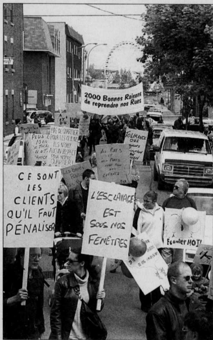
Manifestation des citoyens du quartier Centre-Sud, à Montréal, contre la prostitution de rue. Nous sommes tous des prostituées, et pourtant, c'est la travailleuse du sexe qu'on veut éliminer et qu'on ostracise.

L'analyste financier agit de la même façon: il propose à son client qui le paye des investissements rentables qui lui apporteront plaisir et satisfaction à court ou à long terme. Il existe des artistes de génie et