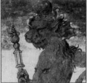
DE L'AN MIL