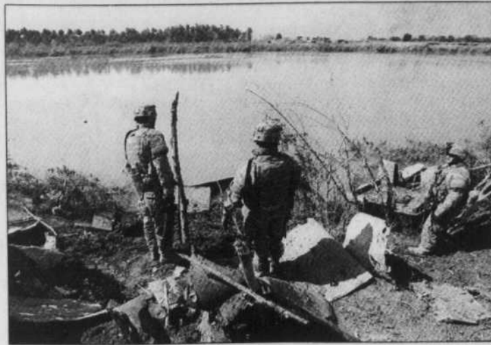
Soldats américains déployés au sud-est de Bagdad

L'armée américaine, composée de 1,4 million d'hommes, est proche d'atteindre les limites de ses capacités avec les missions lourdes en effectifs et de longue