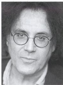
AUTEUR : ERIC ASSOUS

Originaire de la ville de Tunis et Français d'adoption, le prolifique auteur Éric Assous écrit autant pour le théâtre que pour le cinéma, signant notamment plus de 80 textes de radio-théâtre pour la chaîne France Inter. Outre cette énorme contribution, on doit à Assous de nombreuses pièces destinées à la scène, dont Les acteurs sont fatigués , Les Montagnes russes , Les Conjointes , Mon meilleur copain et L'Illusion conjugale pour laquelle il récolte, en 2010, le Molière de l'auteur francophone vivant. Il a également signé la pièce Les Belles-Soeurs , présentée chez DUCEPPE en 2014 dans une adaptation de l'auteur Michel Tremblay... qui l'a renommée L'esprit de famille! En septembre 2013, Éric Assous voit trois de ses pièces prendre l'affiche à Paris, dont Nos femmes