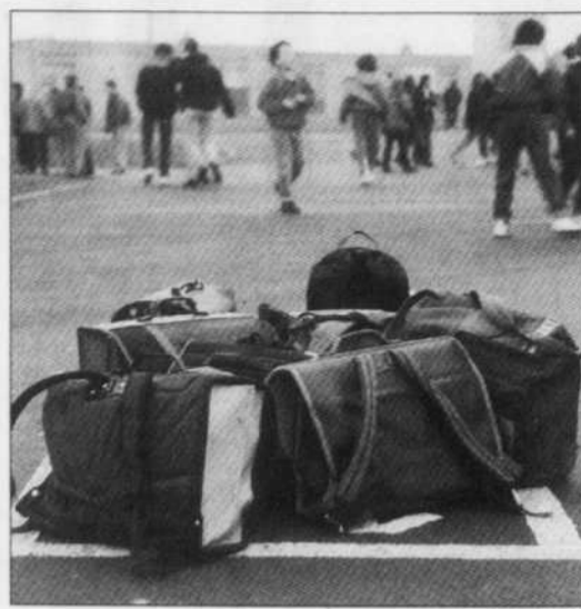
La CSDM prévoit la fermeture de 25 écoles d'ici 10 ans si la chute de clientèle observée se maintient.