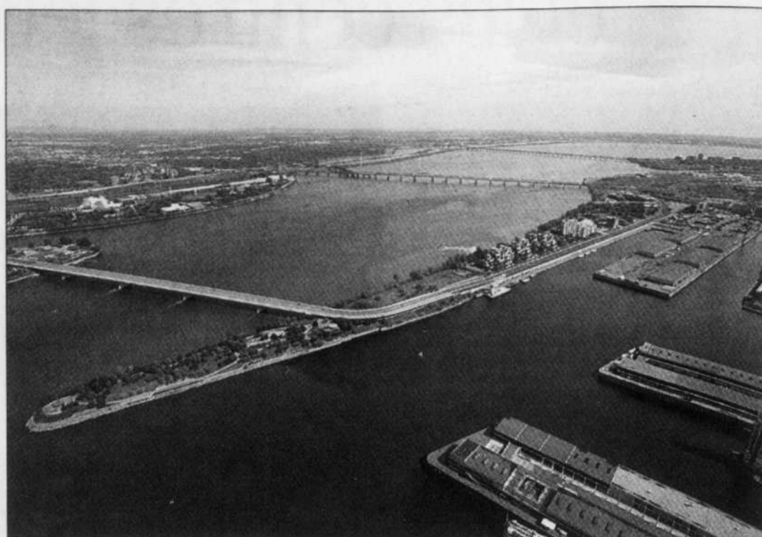
Vue aérienne de la section du fleuve où serait aménager une centrale hydroélectrique, juste en

En 1991, Cree collabore à la rédaction de l'ouvrage Les Langues autochtones du Québec , publié par le Conseil de la langue française du Québec. Elle est