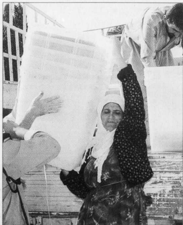
Une Irakienne a transporté hier du matériel en vue du référendum de samedi.

Le Cap — L'Afrique du Sud a abrogé hier la dernière des législations sur lesquelles se fondait le régime d'apartheid. Le Parlement a abrogé le Black Administration Act dans une ambiance de liesse, 11 ans après la tenue des premières élections démocratiques ayant porté au pouvoir un gouvernement noir. Cette législation, adoptée en 1927, permettait au régime d'apartheid de mettre en œuvre une discrimination raciale dans tous les aspects de la vie quotidienne. Le Parlement a jusqu'au mois de juillet 2006 pour modifier toutes les autres lois influencées par le Black Administration Act. — Reuters