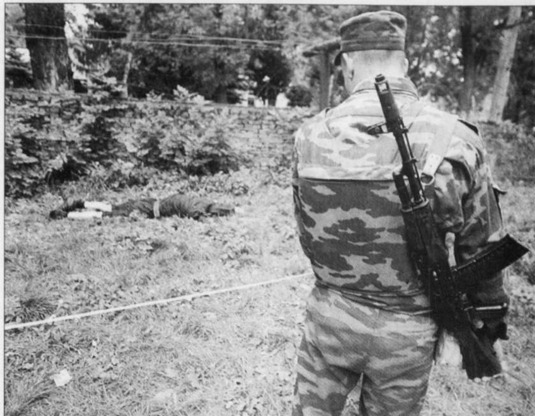
Un membre des forces de sécurité russes surveillait, hier à Naltchik, le lieu d'une des attaques.

Des renforts ont été dépêchés sur les lieux et des hommes des forces spéciales continuaient à