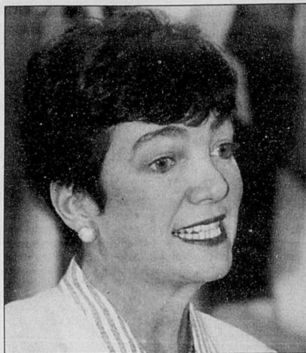
Sheila Copps, ministre du Patrimoine canadien. Le fédéral contribue pour plus de 50 % des sommes que les divers paliers de gouvernement consacrent au Canada à la culture.

Le financement provincial des activités du patrimoine — qui comprennent les musées, les archives, les parcs