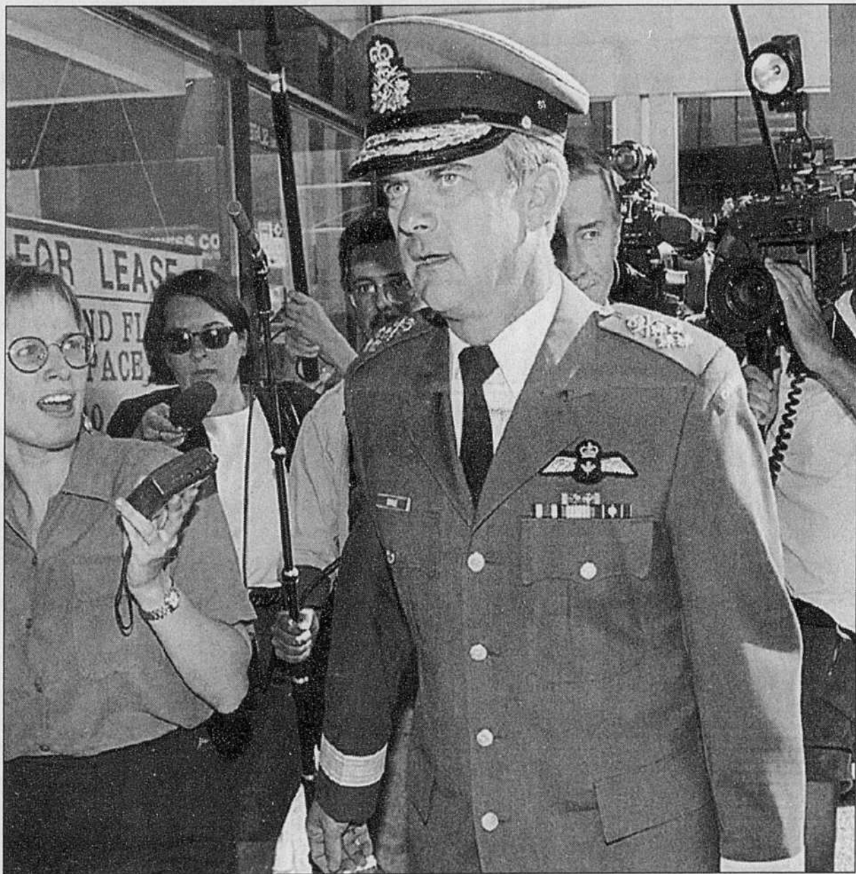
Le général en chef Jean Boyle a entrepris hier son témoignage devant les membres de la Commission d'enquête sur les agissements des Forces armées lors de leur intervention en Somalie. Le général est apparu sûr de lui tout au long de cette première journée de comparution.