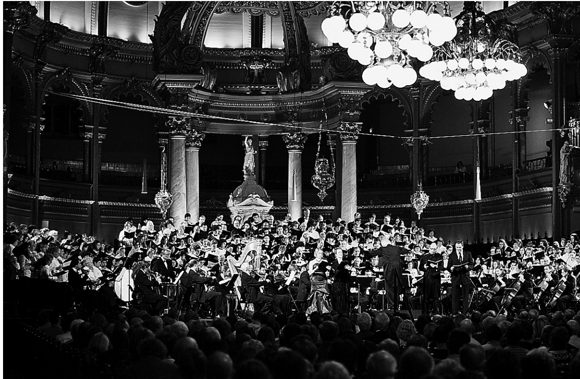
Donné avec 400 choristes, le concert du Vendredi saint de la Société Philharmonique de Montréal a attiré 2500 personnes à Saint-Jean-Baptiste.

Impressionnant comme spectacle, l'événement de deux heures le fut un peu moins au plan musical. M. Takács traduisit le Fauré avec l'intériorité requise et