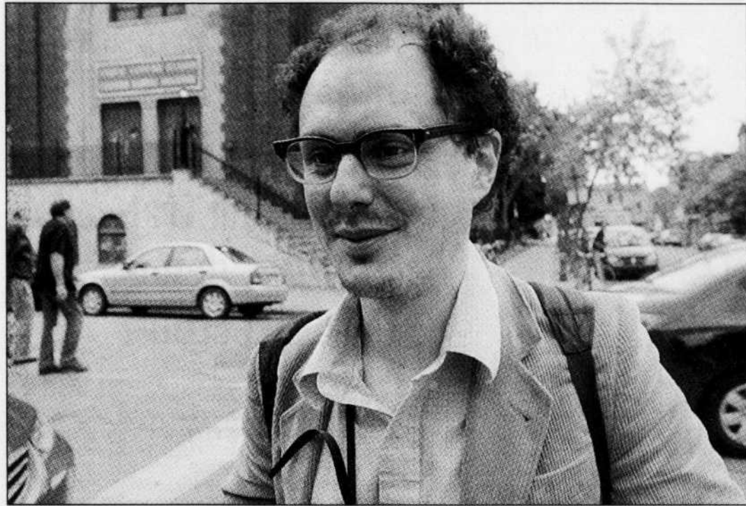
Par son hip-hop aux fortes inspirations klezmer, le sympathique Montréalais Socalled s'est taillé une place enviable dans l'univers musical de 2007.

Les dix meilleurs disques anglophones et instrumentaux de 2007