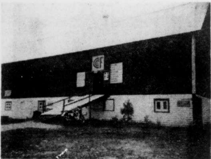
Cette grange, située sur le chemin Capleton, près de Lennoxville, a été aménagée pour des fins culturelles, dans le cadre d'un programme de "Perspective-jeunesse". Elle se complète d'un terrain de camping, où les estivants peuvent se détendre tout en meublant leurs loisirs d'une façon positive.

leur est loisible de se réaliser ou de s'exprimer eux-mêmes à l'intérieur des programmes d'activités qui leur sont proposés.