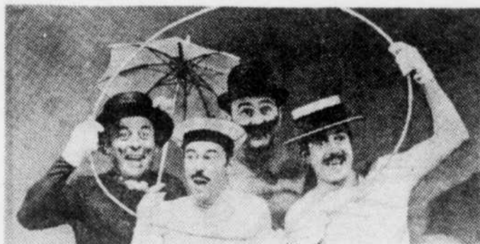
Les frères Jacques en spectacle.

Après le music-hall des frères Jacques, on a rendez-vous à 20h.55 avec le virtuose du violon, Isaac Stern, qui interprète le "Concerto en mi mineur pour violon et orchestre, opus 6", de Félix Mendelssohn. Le Concertgebouw d'Amsterdam est sous la