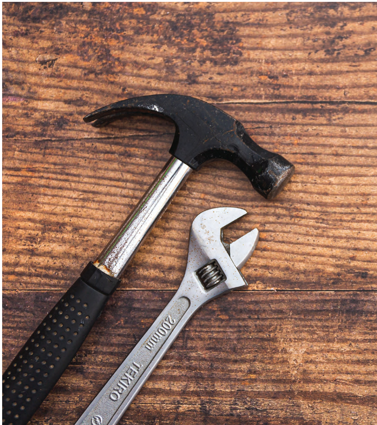
La Couverte est une coopérative de solidarité à but non lucratif dont la mission est la démocratisation de la construction.

«Il y avait déjà le Centre d'action bénévole des Basques qui voulait offrir ce service. Les Centres d'action bénévole offrent souvent la popote roulante ou des services dans le genre, mais c'est très rare les services de proximité qui aident les gens avec leurs travaux et leurs menus travaux de rénovation. Dans le cas du CAB, c'est vraiment quelque chose que les bénévoles peuvent faire : poser une tablette,