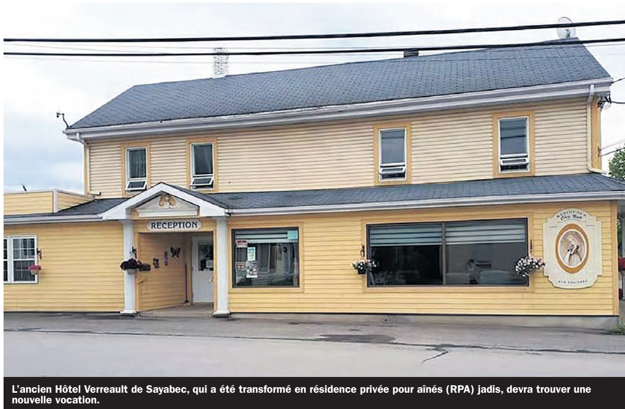
L'ancien Hôtel Verreault de Sayabec, qui a été transformé en résidence privée pour aînés (RPA) jadis, devra trouver une nouvelle vocation.