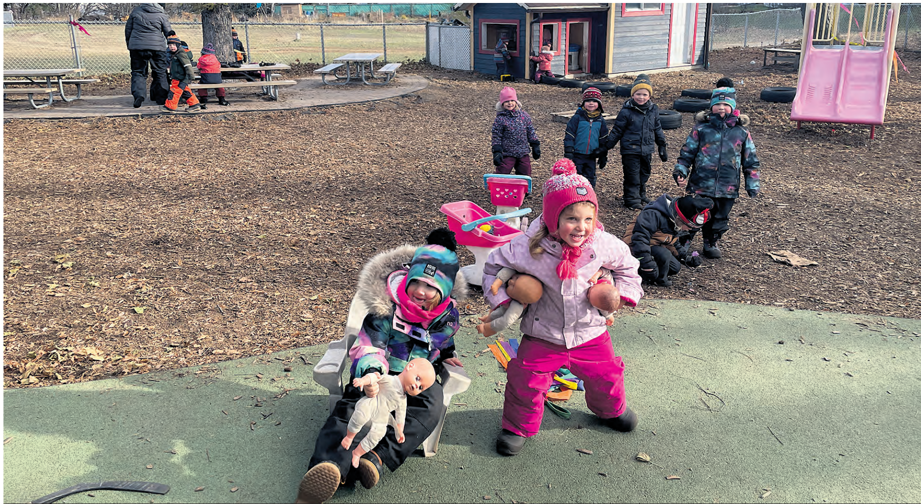
Des enfants qui fréquentent le CPE L'Aurore Boréale.