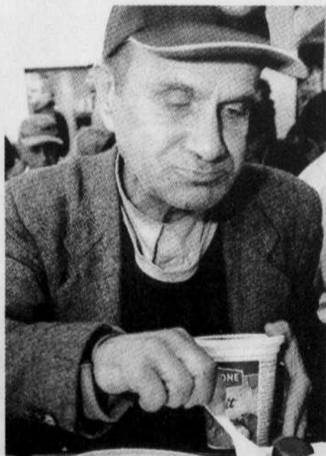
Les montants cités sont les coûts moyens et comprennent les frais de préparation et de service. Un reçu d'impôt sera émis pour tout don de 10$ et plus. Organisme de charité enregistré 10819 5215 RR0001

Nous avons besoin de votre aide pour offrir des repas chauds et procurer d'autres services essentiels en cette période de l'Action de Grâce aux personnes démunies, sans-abri et qui souffrent dans la région de Montréal.