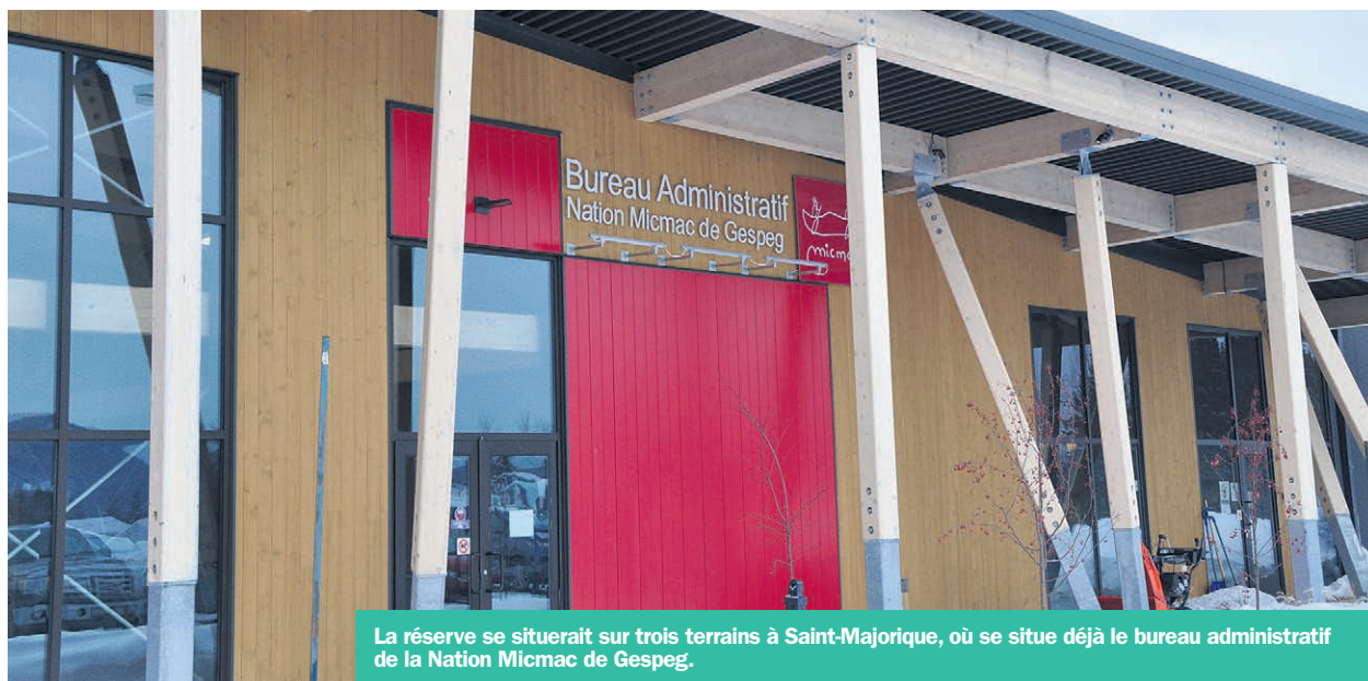
La réserve se situerait sur trois terrains à Saint-Majorique, où se situe déjà le bureau administratif de la Nation Micmac de Gespeg.

Fiscalement, les terrains visés sont déjà exemptés de taxes par la Commission municipale du Québec. Si ces terrains deviennent une réserve, il n'y aura aucun impact fiscal pour Gaspé. L'appui municipal se limite aux