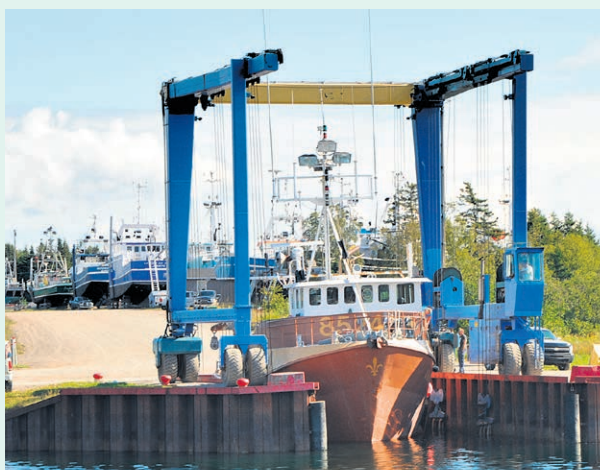
La cale de halage et sa grue portique ont une capacité portante de 150 tonnes. Il en faudrait au moins le double – 300 tonnes – avec les bateaux de pêche de plus en plus gros.

Les travaux – tout aussi urgents – permettent aujourd'hui aux entreprises de reprendre leurs activités de pêche et de transformation à temps pour l'ouverture de la prochaine saison. L'an dernier, une trentaine de bateaux de moins de 40 pieds avaient dû être sortis de l'eau avec une remorque arrivant du Nouveau-Brunswick, alors que d'autres plus gros déjà à terre avaient dû tirer un trait sur leur saison automnale au hareng puisqu'il leur était impossible de retourner à la mer. Le tout venait également créer de l'incertitude au chantier maritime Conception navale FMP. « Les travaux viennent d'être terminés. On a re-