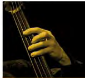
4 juillet 2013 Soûl Call (Jazz)