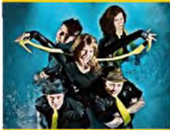
1 er août 2013 Jaune (Néo-rock)