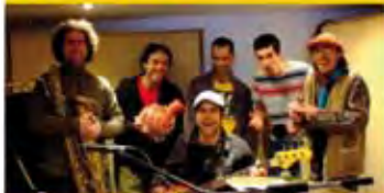
22 août 2013 Obatala (Folk-rock)