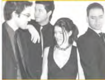
18 juillet 2013 Soul Station (Pop-jazz)