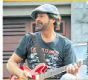
25 juillet 2013 Bureau et les tiroirs (Folk-rock)