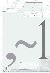
The State of Maine today Maine