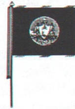
This Flag is proudly used in Maine