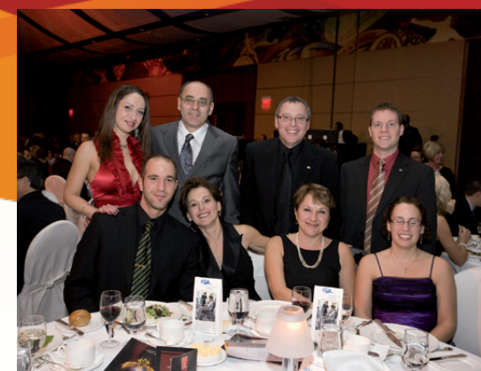
REPRÉSENTANTS DE L'ORDRE DES CGA ONT OFFERT LE COQUETEL DE BIENVENUE.