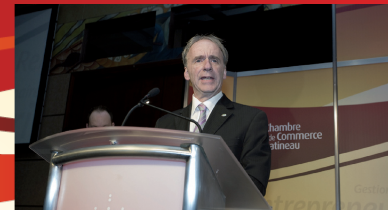
MARC BUREAU, MAIRE DE GATINEAU