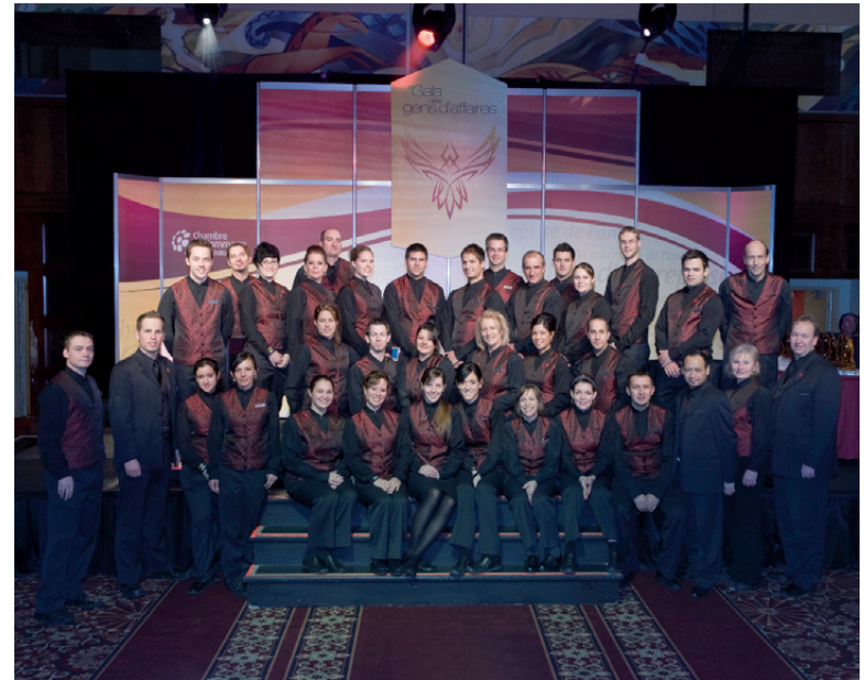
ÉQUIPE DU BANQUET DU CASINO DU LAC-LEAMY