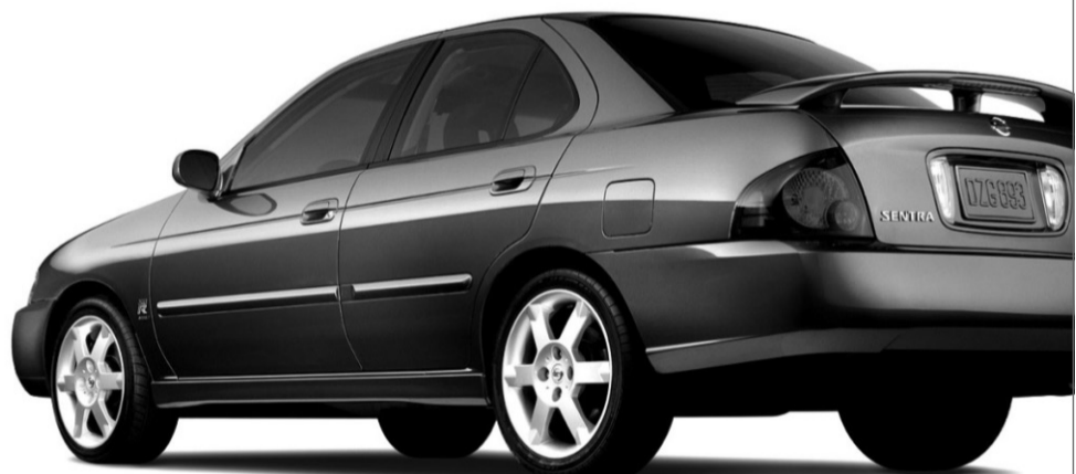
Modèle SE-R Spec V illustré