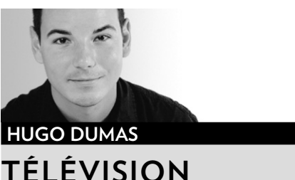
HUGO DUMAS TÉLÉVISION

Des journalistes de la salle des nouvelles de TQS ont de la difficulté à comprendre la nouvelle orientation du réseau qui veut plus de grands dossiers dans ses téléjournaux et moins de nouvelles brutes. TQS abdique-t-elle devant TVA sur la couverture de l'actualité quotidienne ? se demandent des reporters du Mouton noir.