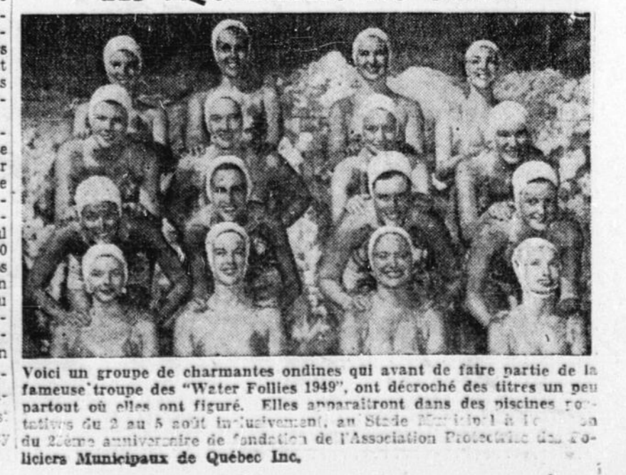
Voici un groupe de charmantes ondines qui avant de faire partie de la fameuse troupe des "Water Folies 1949", ont décroché des titres un peu partout où elles ont figuré. Elles apparaîtront dans des piscines sportives du 2 au 5 août inclusivement, au Stade Municipal à Québec, au 2000 anniversaire de fondation de l'Association Sportive des Collégiens Municipaux de Québec Inc.

Attrayant programme de courses, à l'Expo, ce soir Reprise du programme de mercredi soir. — Quarante-cinq chevaux prendront le départ. — Total de dix épreuves, qui donneront satisfaction aux plus difficiles. — Autre programme, samedi soir. — Worthy Petrella et Joe Judge y seront. C'est ce soir, vendredi, à 7 h. 40 que le Club de Courses sous Harnais de Québec reprendra en entier le programme remis formellement mercredi dernier. C'est dire que les amateurs auront l'opportunité d'assister à une intéressante soirée de courses, la première d'une série de trois jours consécutifs. C'est l'un des programmes les plus imposants de la saison qui est à l'affiche, ce soir. En effet, un nombre très considérable de chevaux sont en lice. Au moins quarante-cinq chevaux prendront le départ. C'est dire que plusieurs intéressés verront leurs favoris à l'oeuvre. Afin de ne pas surcharger les classes, l'organisateur, M. Avila Robitaille, a préparé quatre classes de deux épreuves et deux groupes spéciaux de trotteurs et d'ambleurs qui s'affronteront dans une course d'un dash seulement. Il y aura donc dix épreuves au total. Le nouveau apporté dans la présentation de ce premier soir de courses au meeting de trois jours, nous a souligné le publiciste, M. Henri Bertrand, plaira sûrement à tous les amateurs. Autant la