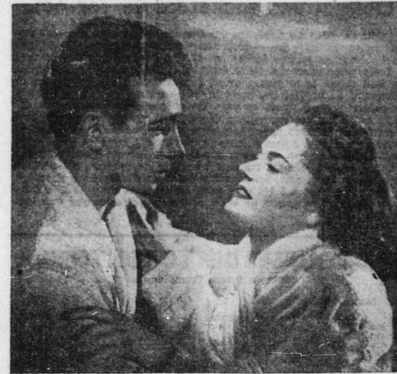
Dane Clark et Alexis Smith dans "Whiplash". Jane Wyman et David Niven dans "A Kiss in the Dark". Ces deux films Warner Brothers en premier seront présentés aux théâtres Empire et Cartier d'aujourd'hui à jeudi.

DU PARIS CLIMATISE EN TOUT TEMPS COMMENTANT DEMAIN Hélène Perdrière et Claude DAUPHIN. ROUTE DE L'ISSUE. En Programme double avec LE ROMAN d'une jeune femme pauvre. DERNIER JOUR "CITE DE L'ESPERANCE" "MARTE RICHARD".