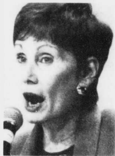
Audrey McLaughlin, chef du NPd

Mais elle a également trouvé le temps de faire des blagues sur sa difficulté à maîtriser le français et sur un récent sondage Gallup qui disait que 59 pour cent des Canadiens ne savaient pas qui elle était.