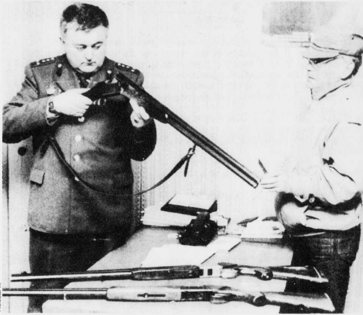
Hier, quelques Litoniens répondaient à l'ultimatum des autorités soviétiques qui les sommaient de rendre leurs armes personnelles au plus tard pour... hier.

ouverte aux dissidents». De fait, «de nombreuses personnes craignent les conditions de cette démocratie», a-t-il confié dans un entretien diffusé hier dans le journal «Sovietskaya Rossiya», organe officiel du grand voisin de la Lituanie, la République de Russie.