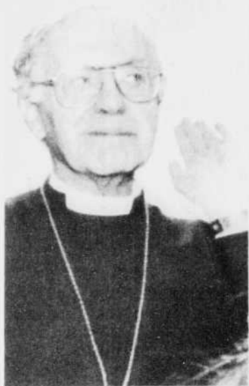
Mgr Robert Runcie, archevêque de Cantorbéry

L'annonce de sa décision 10 mois à l'avance devrait laisser suffisamment de temps au premier ministre Margaret Thatcher pour désigner son successeur. Et l'on