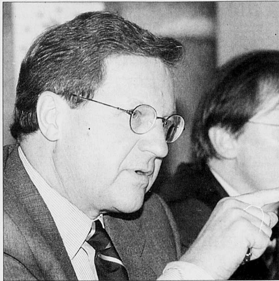
Le ministre canadien des Affaires étrangères, Lloyd Axworthy, hier à Vienne.

Le ministre français des Affaires étrangères Hubert Védrine, qui venait de ren-