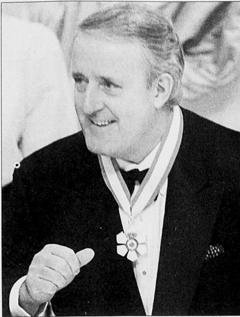
Brian Mulroney a accepté sa décoration avec une vive satisfaction.