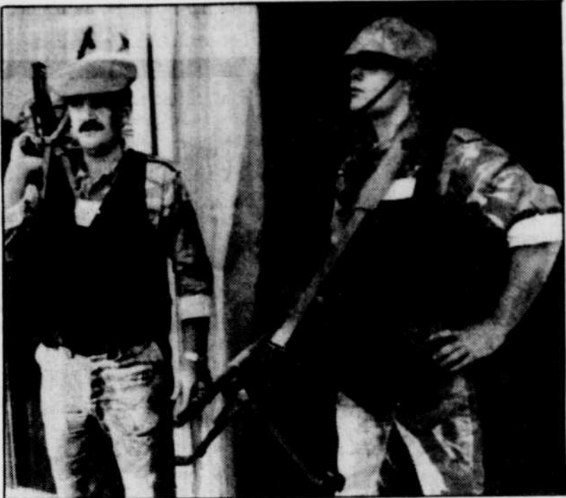
Armés jusqu'aux dents, ces deux policiers libanais montaient la garde, hier, devant l'immeuble où le président Hraoui et le premier ministre Selim Hoss échafaudent un cabinet ministériel.

Il a ajouté que si le général Aoun, chef du gouvernement de militaires, s'obstinait, « Beyrouth eût approuvé la formation d'un nouveau cabinet ministériel qui