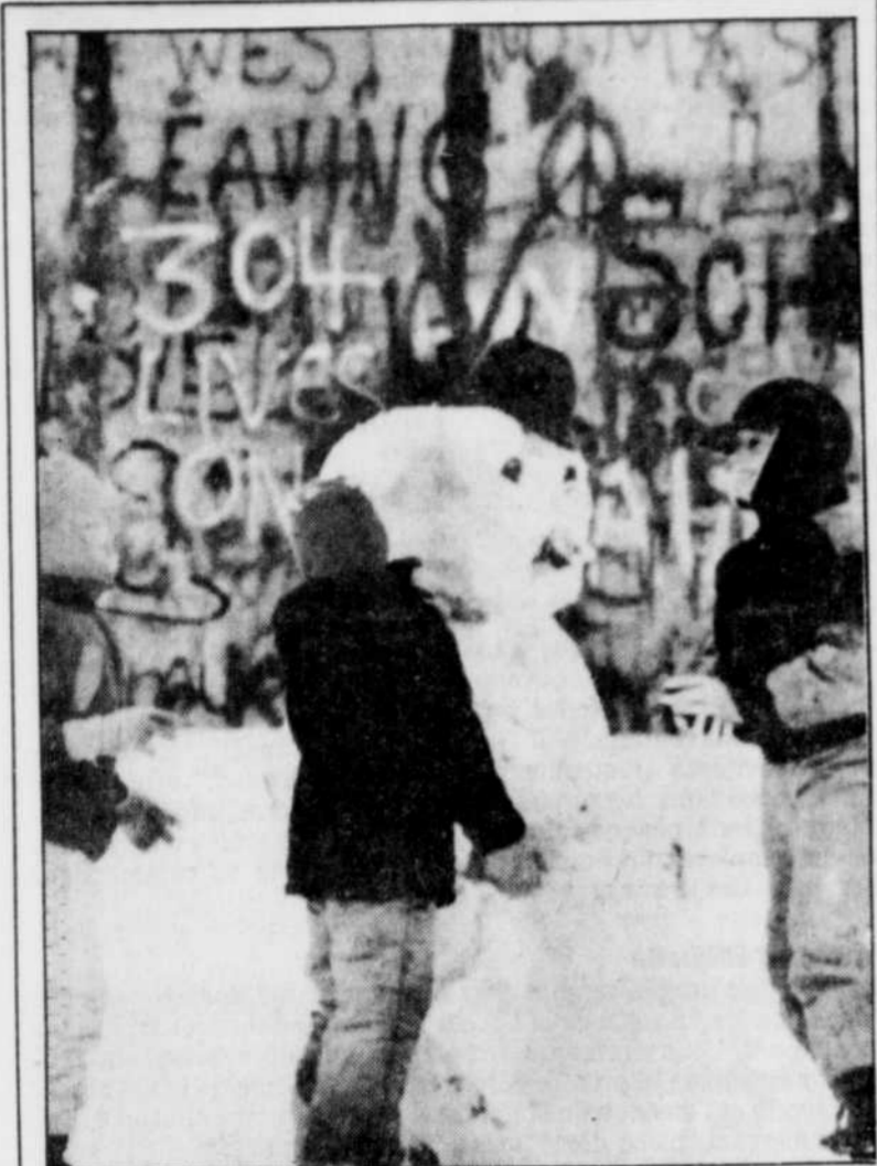
Le Bonhomme à Berlin

Des enfants s'en donnent à cœur joie en croyant donner vie à ce bonhomme de neige édifié à quelques pieds du mur de Berlin ou en tout cas de ce qui en reste.