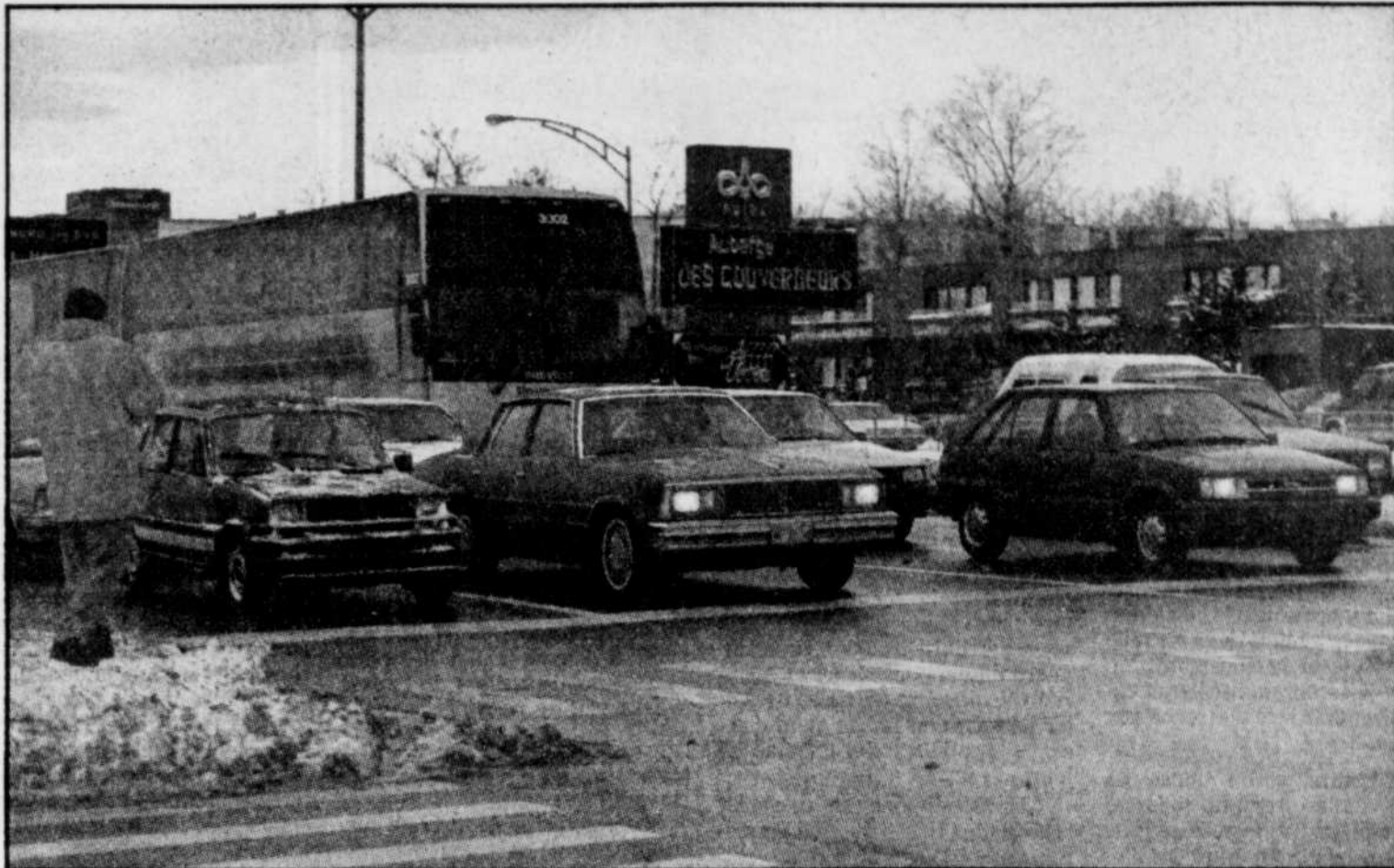
Les phares sont davantage utilisés le jour sur les grandes artères de la périphérie et sur les ponts de Québec.

Tous les véhicules automobiles ont été répertoriés, ce qui comprenait camions légers et lourds ainsi que les autobus. Notons que plus de la moitié des autobus et environ un camion sur deux circulaient les phares allumés, ce qui n'est pas le cas des petits camions et camionnettes qui se comportent davantage comme des automobiles.