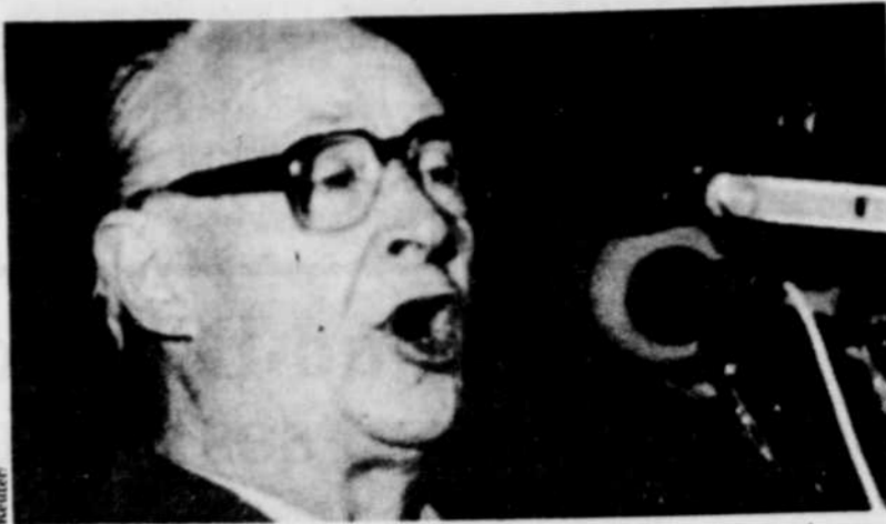
L'une des vedettes de l'heure en Tchécoslovaquie, Alexander Dubcek, comme au beau temps du Printemps de Prague, en 1968.

PRAGUE (AFP, AP) — Dans un vaste élan de réconciliation, le premier ministre Ladislav Adamec, Alexander Dubcek, leader du « Printemps de Prague » et l'écrivain Vaclav Havel, chef de file de l'opposition, sont apparus pour la première fois côte à côte hier devant 500 000 personnes à Prague, manifestant ainsi leur volonté de réaliser un véritable consensus national en Tchécoslovaquie.