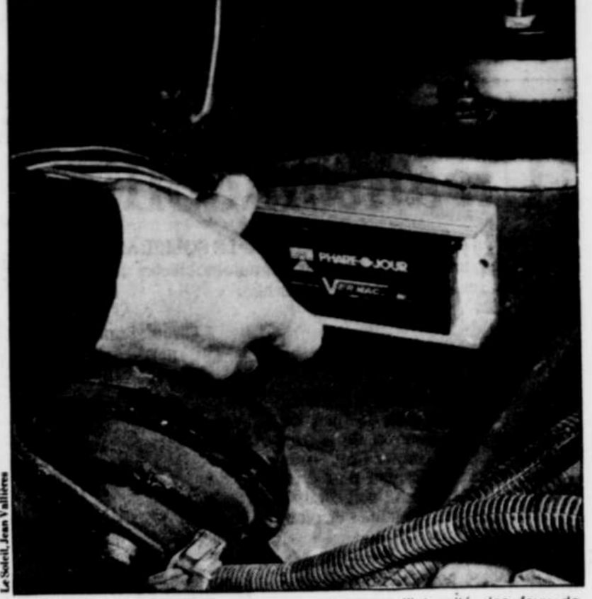
Dans les ateliers spécialisés, on peut faire installer de tels dispositifs à des coûts variant entre 50 $ et 60 $. Ici, chez G. Lebeau, l'appareil Phare-o-jour se fixe près de la batterie et relie les fils des phares, réduisant l'intensité des feux de croisement à 50 % lorsqu'ils sont utilisés comme feux de jour. Ils s'éteignent automatiquement deux ou trois secondes après la fermeture de la clef de contact.