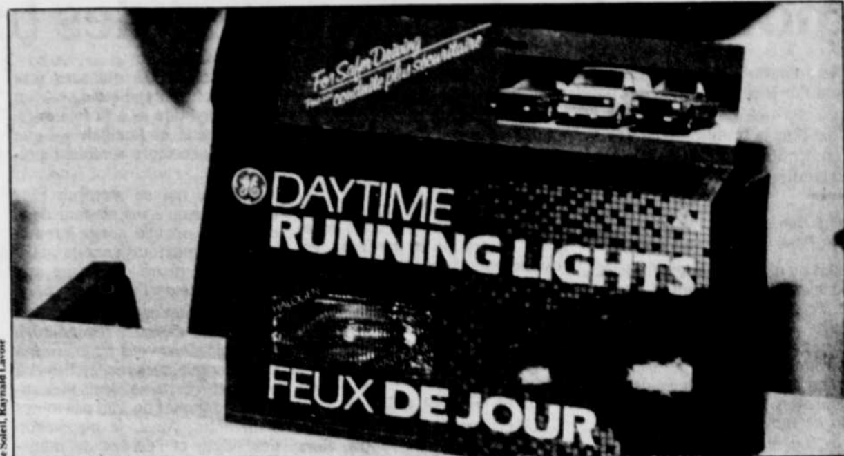
Il n'y a pas d'argument solide qui justifie un conducteur de ne pas garder ses phares allumés en tout temps.

« Si tous les véhicules circulent avec des phares allumés, on finira par s'accoutumer et ne plus les