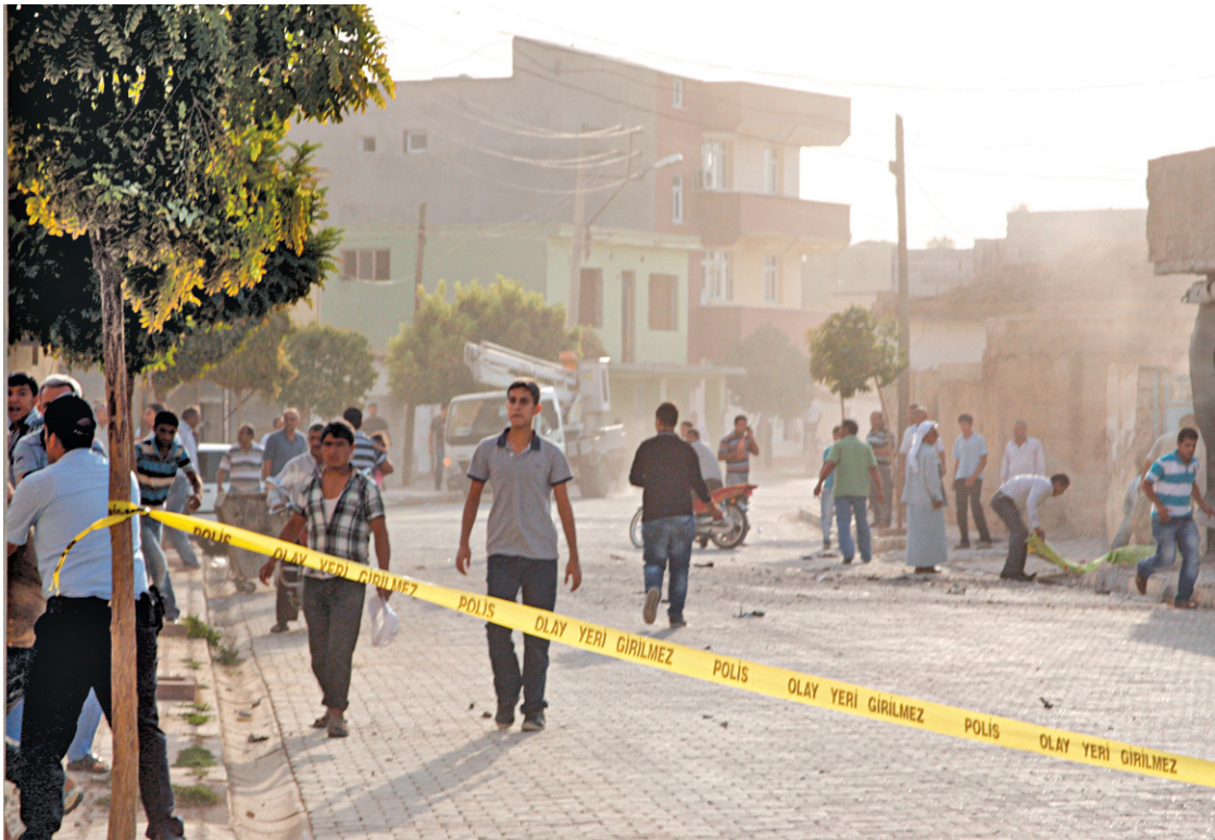
Les habitants d'Akçakale ont accouru mercredi pour aider les blessés par les tirs syriens.