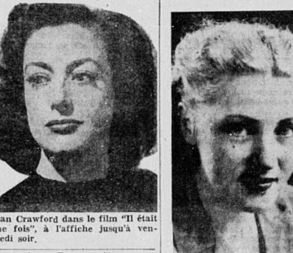
Joan Crawford dans le film "Il était une fois", à l'affiche jusqu'à vendredi soir.