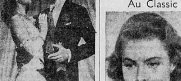
Fred Astaire dans "Holiday Inn" à l'affiche jusqu'à vendredi soir, avec le grand dame français, "Les Mystères de Paris".