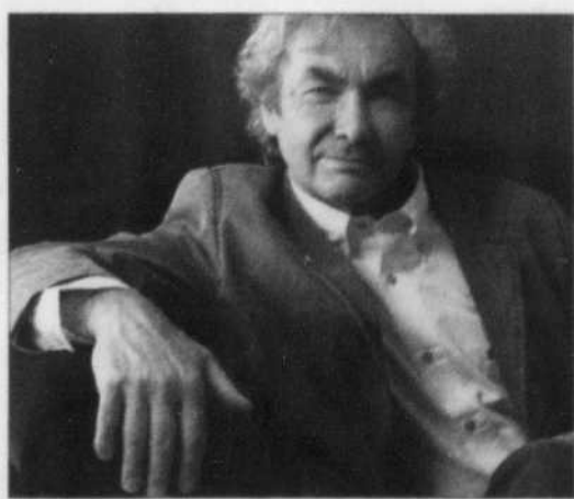
EDITIONS DE L'HOMME

Et aujourd'hui plus qu'hier, ce comportement, que Freud percevait comme un trait destructeur inhérent à la nature humaine, serait même devenu valorisé. Telle une vertu, on en ferait désormais l'éloge, constate avec dépit le sociologue au Centre national de la recherche scientifique