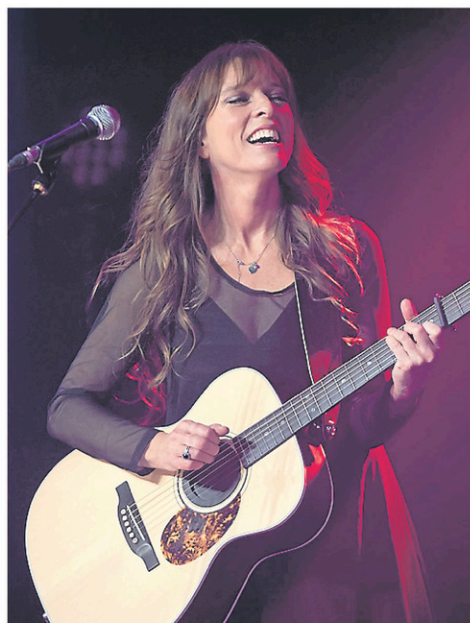
Lynda Lemay