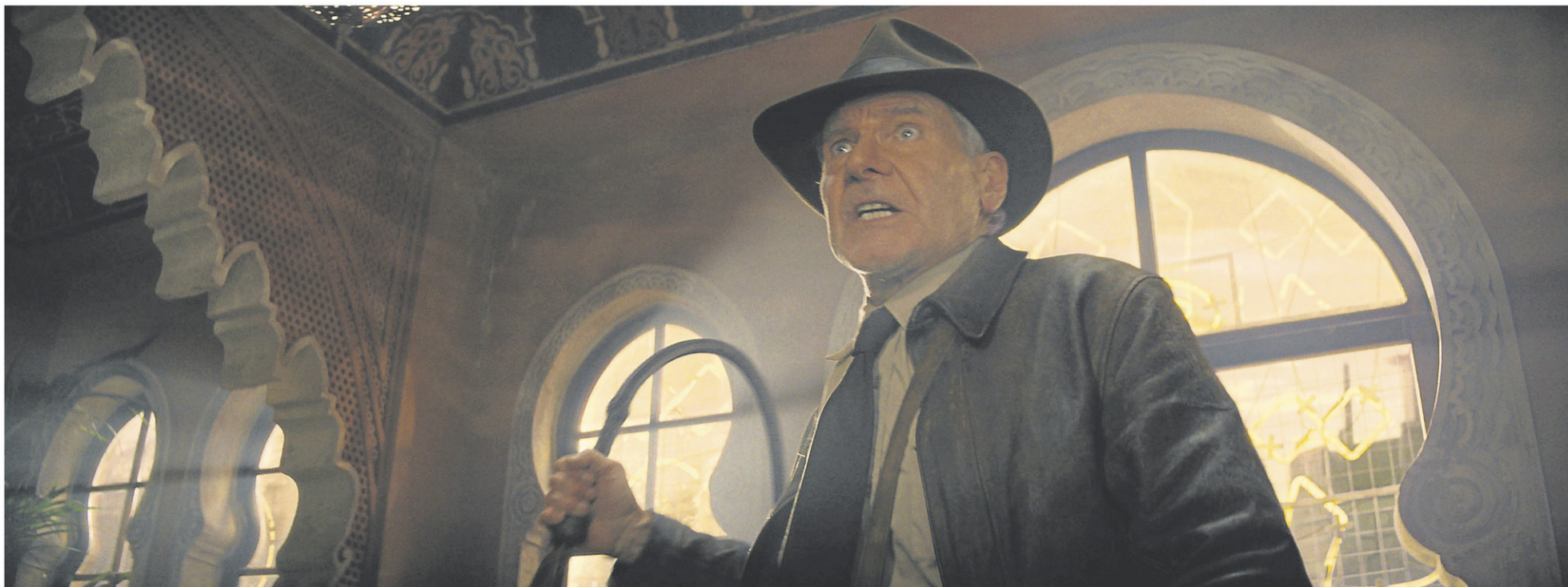
À 80 ans, Harrison Ford incarne Indiana Jones pour la dernière fois dans Le cadran de la destinée.