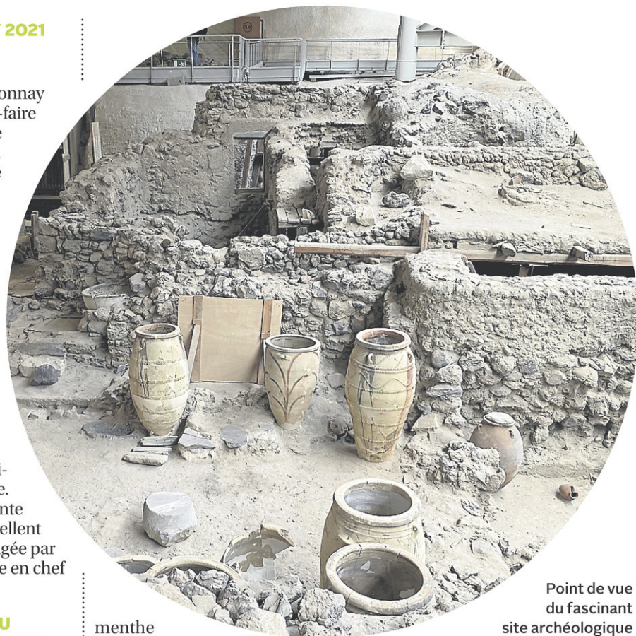
Point de vue du fascinant site archéologique d'Akrotiri à Santorin, où on a découvert des amphores bien préservées qui datent de l'âge de Bronze.

Pour des suggestions quotidiennes de vins, suivez-moi sur Instagram @nrartdevivre ou sur mon site natalierichard.com