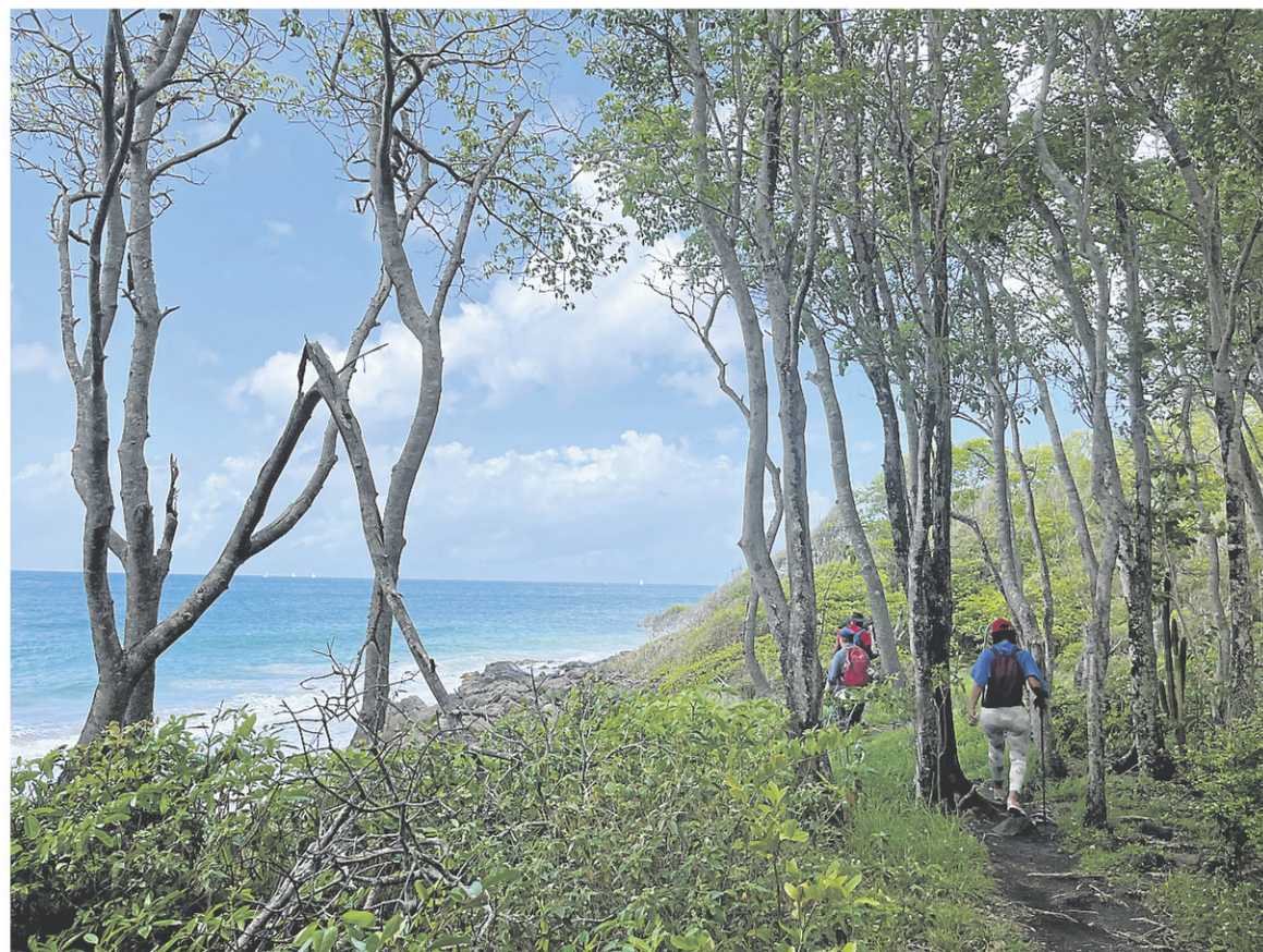
Le sentier du littoral passe de la forêt, aux mangroves, à la mer.

Au sud, par exemple, le sentier littoral du Diamant, si on le longe dans son entièreté, est long de 11 km. Il s'étend du stationnement La Taupinière et suit la Grande Anse du Diamant jusqu'à la maison du Bagnard, dans le bourg du Diamant. Là, le dénivelé est pratiquement inexistant, mais les points de vue sur la mer sont jolis.