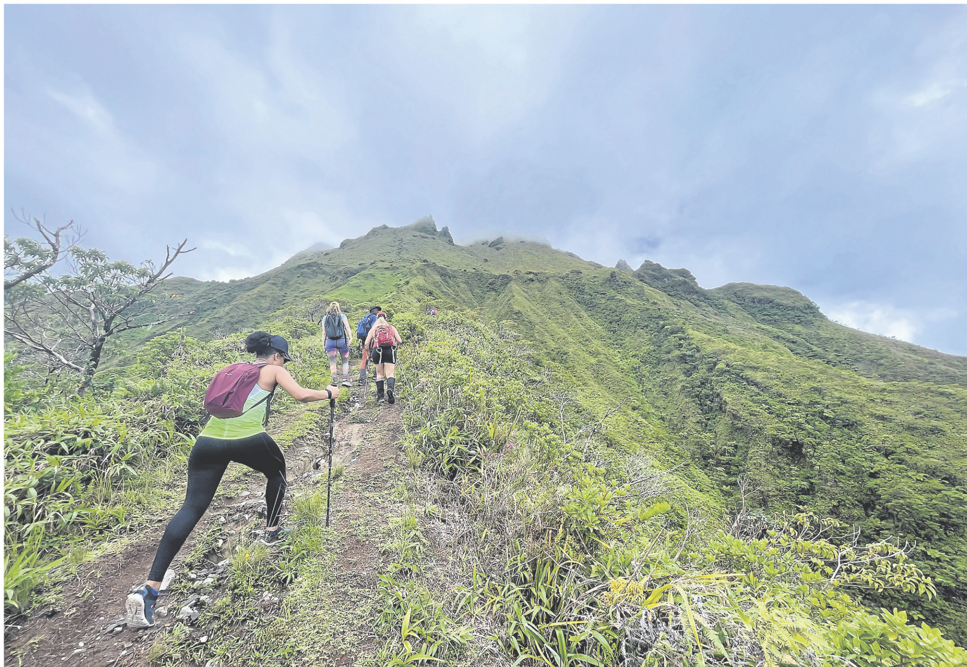
La montagne Pelée, à 1397 mètres, est le sommet le plus élevé de Martinique. On raconte que ceux qui aperçoivent le sommet de la Pelée retourneront en Martinique.

À moins d'avoir le pas très (trop) rapide, on apercevra des crabes partout dans les mangroves. Le crabe figure d'ailleurs au menu du repas traditionnel de Pâques martiniquais, le matoutou. Étrangement, le matoutou est aussi une espèce endémique de mygale arboricole qu'on ne trouve qu'en Martinique et qui peut atteindre 18 cm.