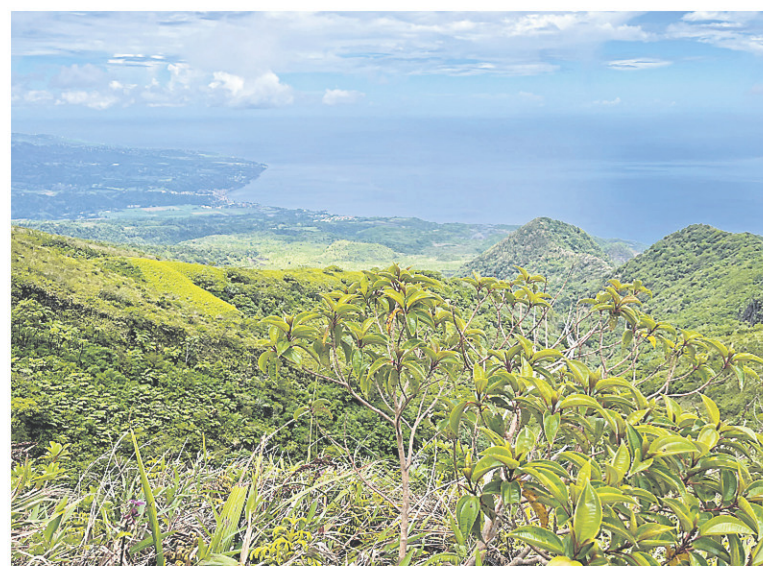
Sur la montagne Pelée, on compte 69 espèces d'arbres et arbustes endémiques de la Martinique.

Le journaliste était l'invité du Comité martiniquais du tourisme et d'Air Canada.