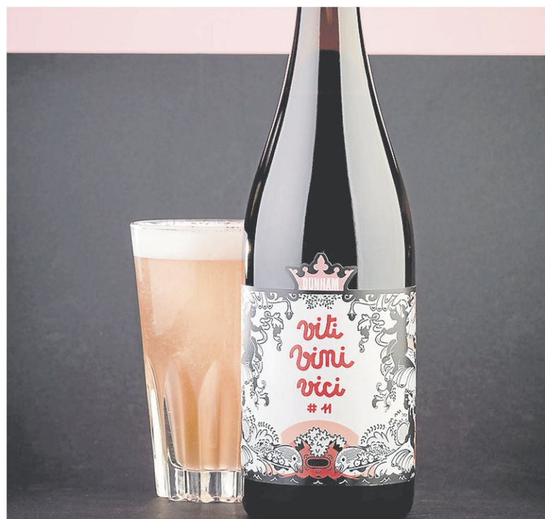
La gamme Viti Vini Vici de la Brasserie Dunham.

La Brasserie Dunham s'est associée au Vignoble Val Caudalies pour créer un hybride bière-vin composé de 50 % de bière de foudre et de 50 % de moût de Frontenac noir et Petite Perle. Étant donné que ce produit a été lancé après la rédaction de cette chronique, je n'ai pas encore eu l'occasion de le goûter, mais compte tenu de la réputation de