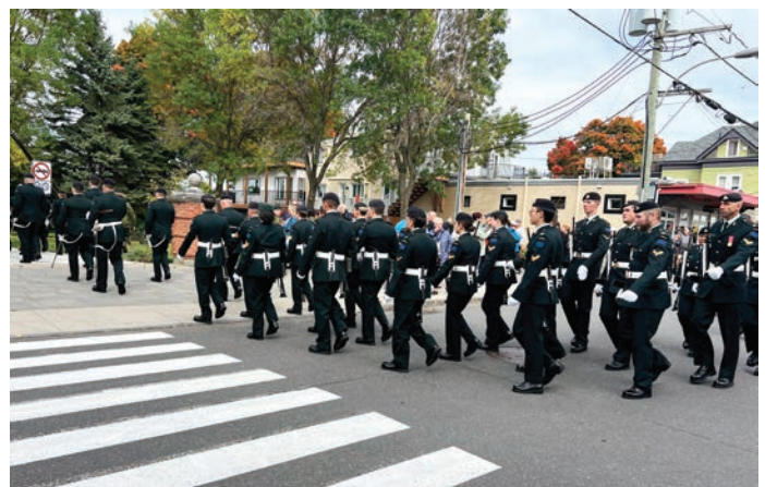
La parade s'est déroulée dans le secteur du Vieux-Saint-Romuald avec un départ au Juvénat Notre-Dame.