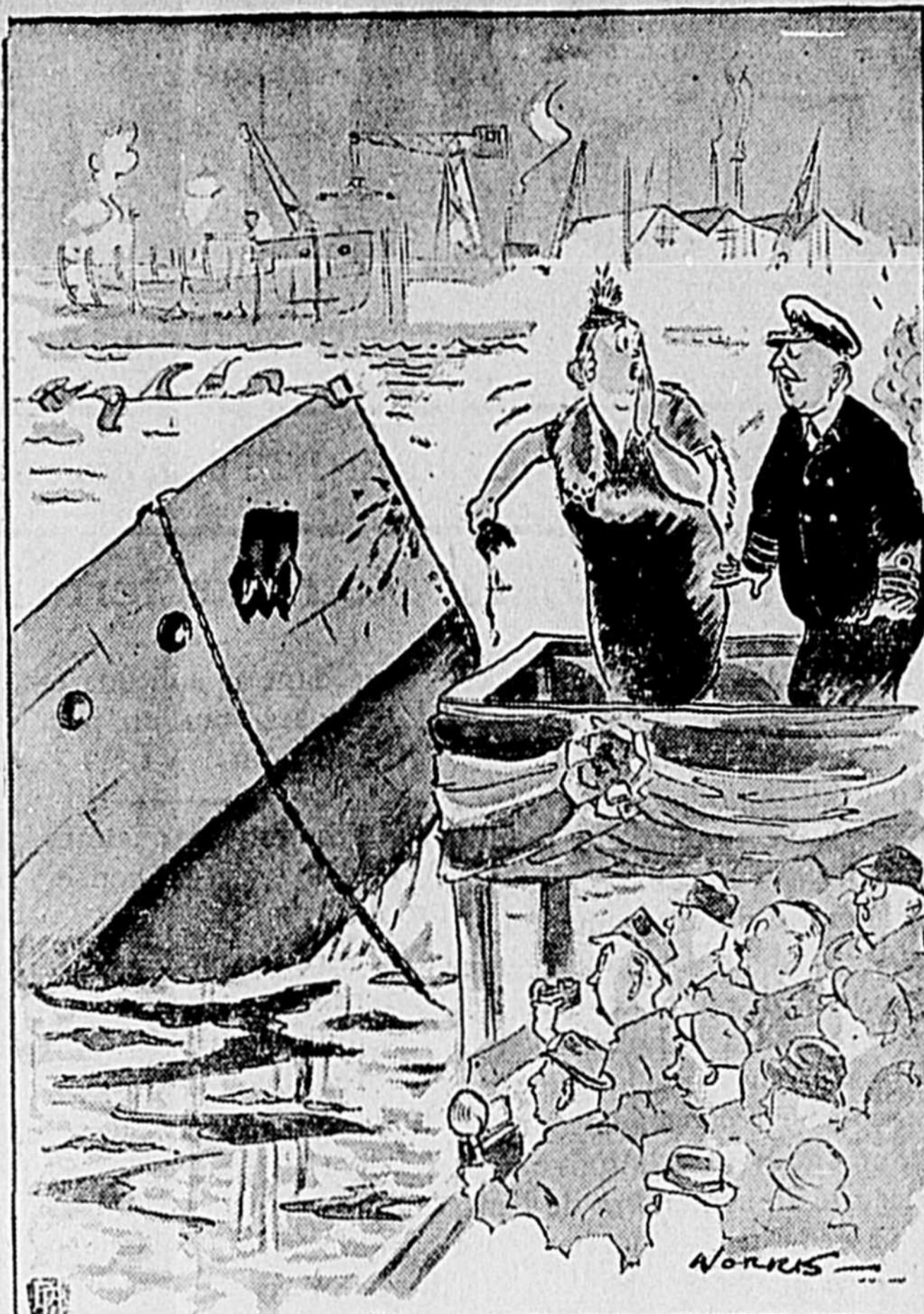
"Oh! malheur! Je n'ai pas voulu frapper si fort que cela!"