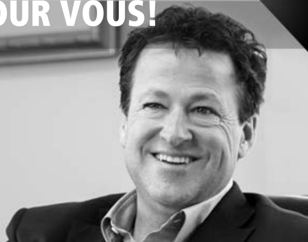
DONALD MARTEL Député de Nicolet-Bécancour