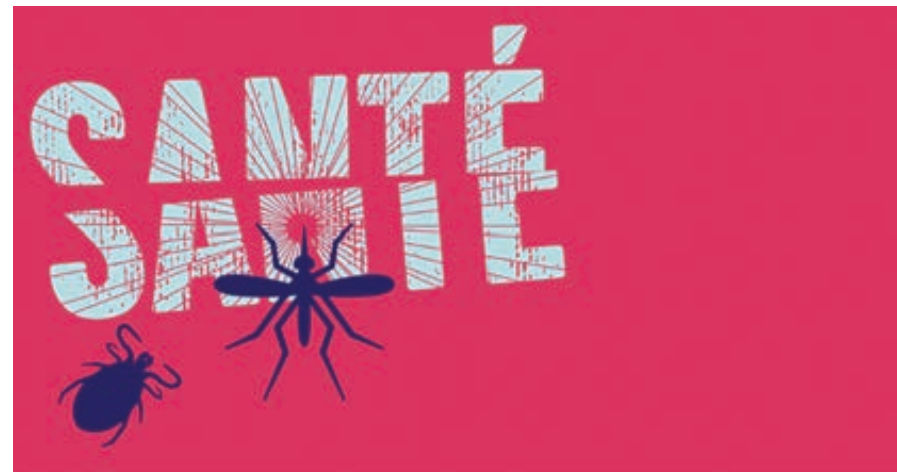
ILLUSTRATION MINISTÈRE DE LA SANTÉ ET DES SERVICES SOCIAUX / www.msss.gouv.qc.ca/

Le ministère de la Santé et des Services sociaux invite à la prudence afin de prévenir les infections transmises par les moustiques et les tiques.