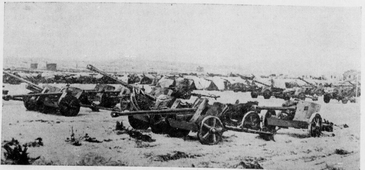
A part les quelques canons endommagés au-delà de toute réparation possible, les canons cap-turés à l'ennemi sont remis en état de servir, et leur feu asperge leurs anciens propriétaires. Et c'est très bien ainsi, car d'énormes quantités de matériel ont été ainsi saisies, et servent aujour-d'hui la cause alliée. Dans la photo, on peut voir un enclos où sont remises des canons capturés