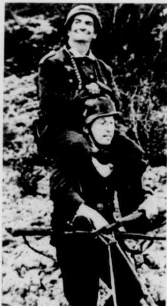
La Grande Vadrouille