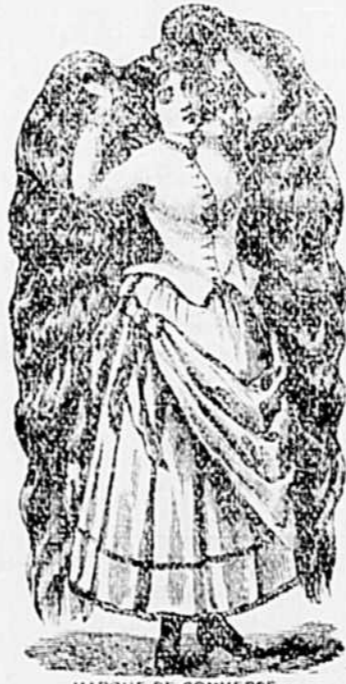
MARQUE DE COMMERCE.