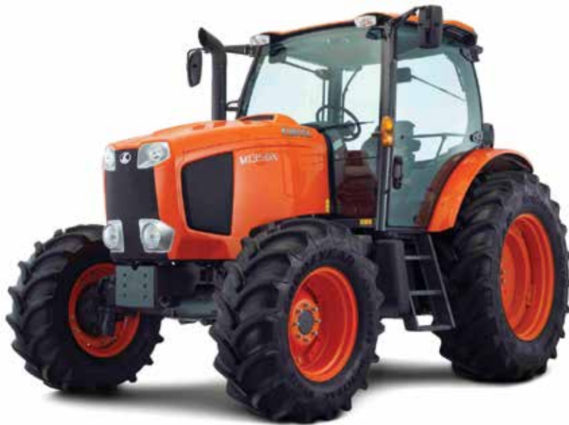
MGX135: cette série couvre 100 ch à 135 ch au moteur. La transmission 24x24 est aussi disponible en vitesse rampante. Elle offre une impressionnante force de relevage 3-points et les sorties hydrauliques peuvent être munies d'un contrôle de débit en option.

élevé et sur une plage élargie qui peut éviter de devoir rétrograder dans le transport en pentes, explique Dominique Milot. La réponse est rapide et adaptée à toutes les charges, ajoute-t-il.