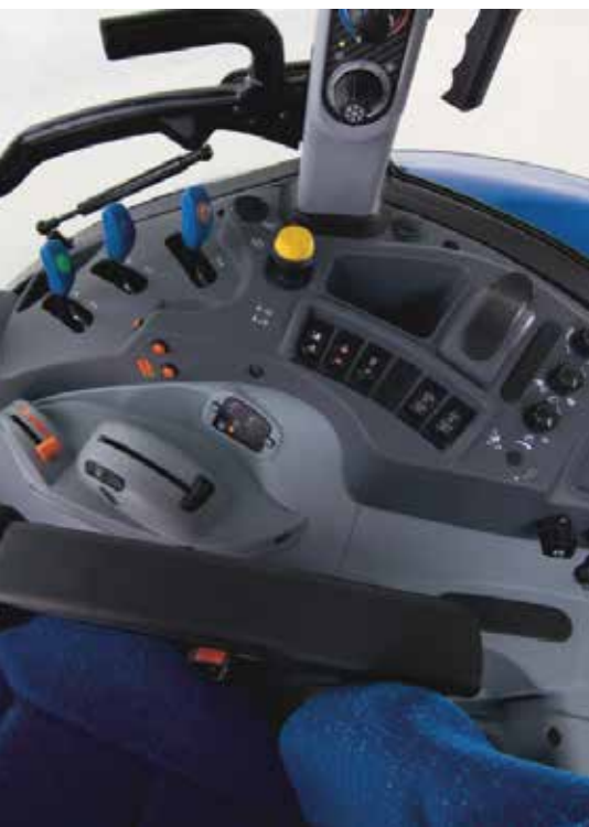
Une option de levier électronique monté sur l'accoudoir est disponible sur les T5.

levier de mécanique du chargeur est situé juste à côté du levier de vitesse réduisant ainsi les mouvements nécessaires. Une option de levier électronique monté sur l'accoudoir est disponible sur les T5. Pour le chargeur lui-même, New Holland met l'accent sur la force d'arrachement et la hauteur de levée, indique M. Cardin.