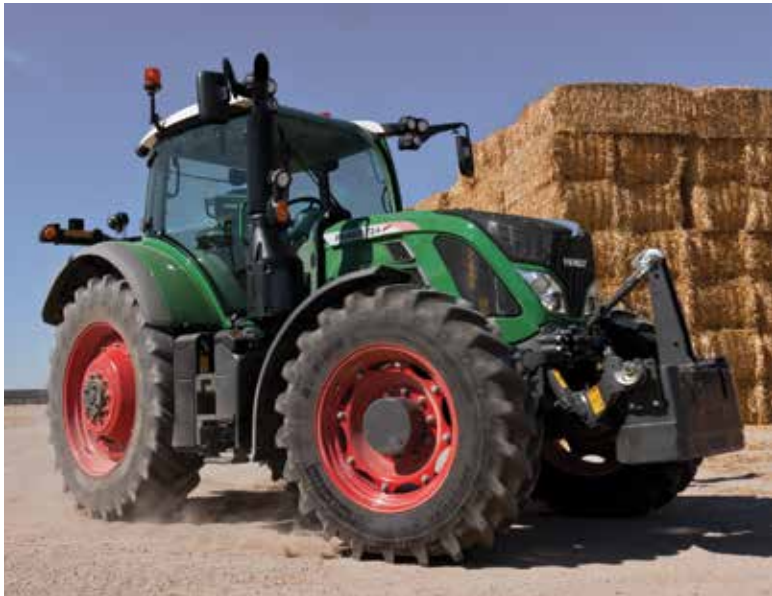
Le plus petit des 700 se veut l'ultime tracteur à chargeur. Il reprend plusieurs technologies disponibles sur les tracteurs de grande puissance dans un gabarit et une puissance recherchée pour les applications d'élevage.