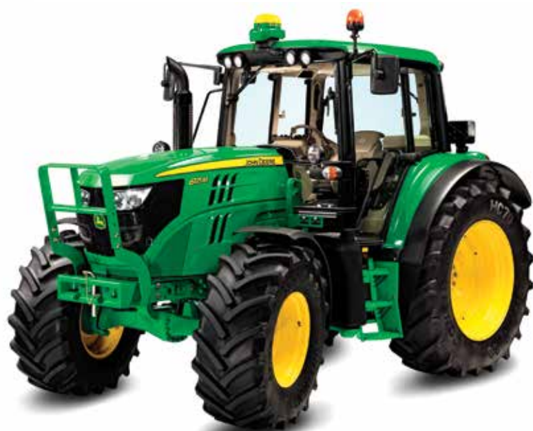
6115M: avec sa cabine exclusive à la série M et son châssis en acier unique à John Deere, c'est un incontournable bourreau de travail pour les travaux de champ et de chargeur. Idéal pour les clients, il offre plusieurs options et contient peu d'électronique embarquée.

levier de mécanique du chargeur est situé juste à côté du levier de vitesse réduisant ainsi les mouvements nécessaires. Une option de levier électronique monté sur l'accoudoir est disponible sur les T5. Pour le chargeur lui-même, New Holland met l'accent sur la force d'arrachement et la hauteur de levée, indique M. Cardin.