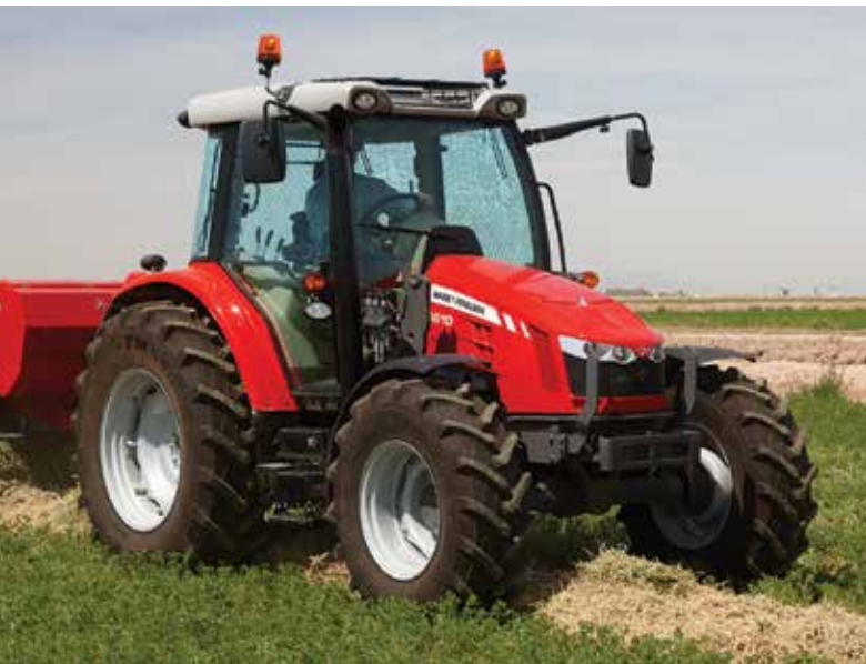
La série 5600 se veut un tracteur compact haut de gamme pour les travaux de chargeur avec un levier multifonction, une transmission évoluée et plusieurs options dont la suspension et le relevage avant intégré.