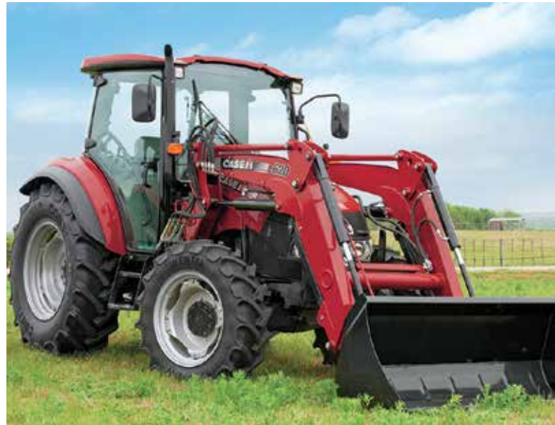
Farmall 75C: un excellent modèle pour les agriculteurs, les paysagistes et les municipalités. La combinaison de robustesse, efficacité, flexibilité et confort de l'opérateur en font un féroce concurrent de par son rapport qualité-prix.

transmissions s'étend jusqu'à trois selon le modèle avec 16 vitesses, 24 vitesses ou CVT. À noter que la gestion dynamique moteur-transmission est disponible autant en CVT qu'en Powershift. La fonction d'automatisme Auto-Drive est elle aussi de série sur les Autopower IV et VI.