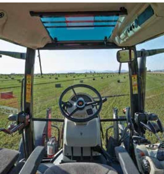
Avec son capot plongeant et des montants de cabine arrondie, le 5600 offre une visibilité sans encombre.

L'offre de Challenger dans ce segment se limite à la série 400D comprenant cinq modèles de 90 ch à 125 ch, tous munis d'un moteur AgcoPower de 4,9L employant la technologie SCR. Kevin Blaney explique que le tracteur peut être équipé de trois niveaux d'options soit Classic, Deluxe et Premium. La version Premium intègre entre autres une suspension avant, un terminal compatible Isobus, le contrôle électronique des valves hydrauliques et une pompe de type load sensing avec un débit maximum de 110L/min. Le choix de