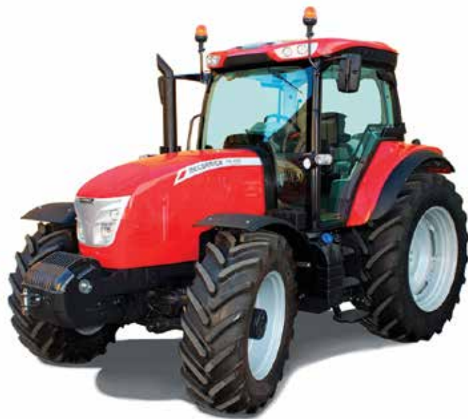
X6.430: un tracteur moderne au design raffiné. Possédant une liste complète d'options, il peut être un tracteur simple et, selon les besoins, il peut aussi être équipé d'éléments que l'on retrouve normalement sur des modèles de plus grande puissance.