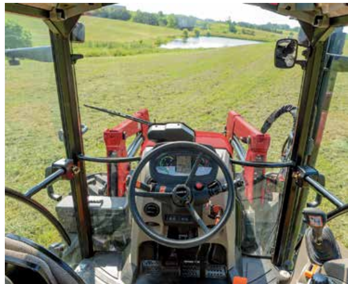
La cabine de la série Farmall offre un environnement luxueux avec confort et une excellente visibilité.