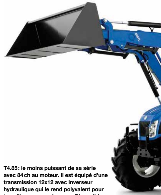
T4.85: le moins puissant de sa série avec 84 ch au moteur. Il est équipé d'une transmission 12x12 avec inverseur hydraulique qui le rend polyvalent pour travailler avec un chargeur. Disponible autant en version plateforme ou cabine, il peut être équipé ou non d'un essieu avant moteur.

Kubota fabrique ses propres moteurs. La combinaison DOC et DPF a été ajoutée à l'EGR pour répondre aux normes Tier 4i. M. Haney explique que le système de filtre à particules requiert relativement peu d'entretien et est facile à opérer si les cycles de régénération sont complétés comme requis. Un mode inhibiteur permet de retarder les cycles de régénération selon l'application ou l'environnement. La plupart du temps, les opérations à