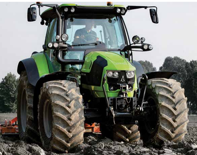
Un choix de transmission varié, la fonction Stop&Go et 4 vitesses de PDF de série (540, 540E, 1000 et 1000E) en font un tracteur très polyvalent et configurable selon les besoins du client.