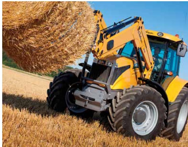
Modèle très populaire chez Challenger dû à son petit gabarit. Le 455D est idéal pour les travaux de chargeur grâce à son levier multifonction. Ce dernier permet d'opérer l'embrayage, l'inverseur, les rapports de transmission et toutes les fonctions du chargeur.