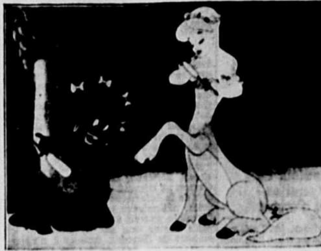
AU HIS MAJESTY'S — Walt Disney s'est fait l'interprète de chefs-d'oeuvres de la musique dans "Fantasia", dont la première aura lieu lundi soir, à 8 h. 30, au His Majesty's. Ci-dessus: une centenaire de la sixième symphonie de Beethoven.