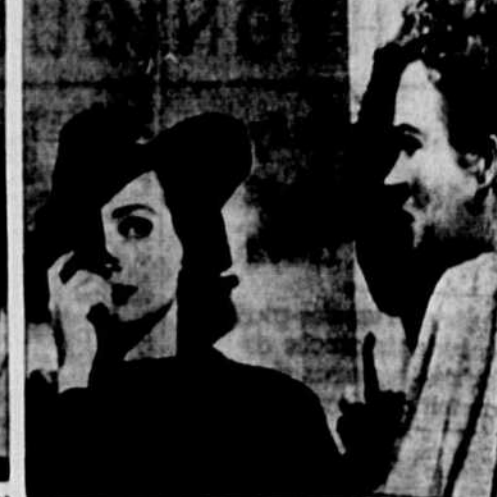
AU PALACE — Joan Crawford et Osa Massen dans une scène du drame "A Woman's Face", qui prendra l'affiche demain.