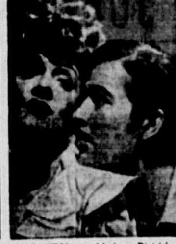
AU CAPITOL — Marlene Dietrich et Bruce Cabot dans une scène du film "The Flame of New Orleans", qui prendra l'affiche demain.