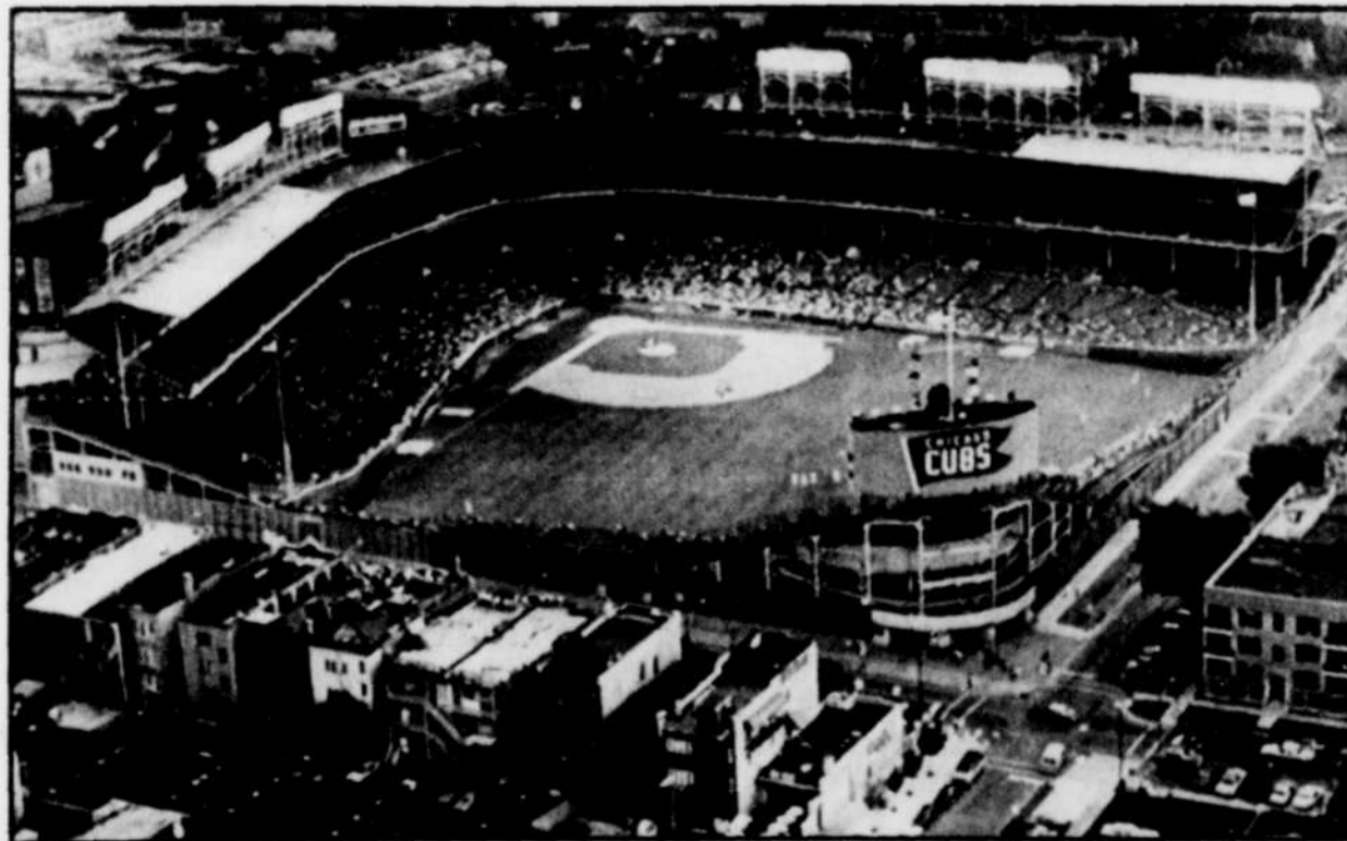
Beaucoup de curieux s'étaient donné rendez-vous pour assister à cet événement historique.

Mais qu'a-t-on pensé? À moins justement qu'on n'ait pas pensé! Avec le nombre restreint de vestiges que le passé nous laisse dans le sport, il serait peut-être bon de les conserver.