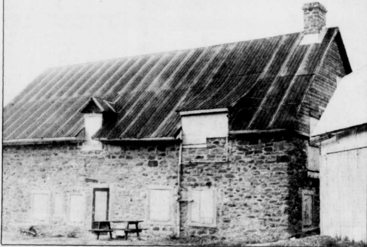
À compter de lundi prochain on procédera à la dernière phase des travaux de rénovation du Moulin Michel à Gently. Ce nouvel équipement culturel et touristique pourra donc être ouvert à la population en novembre ou décembre.