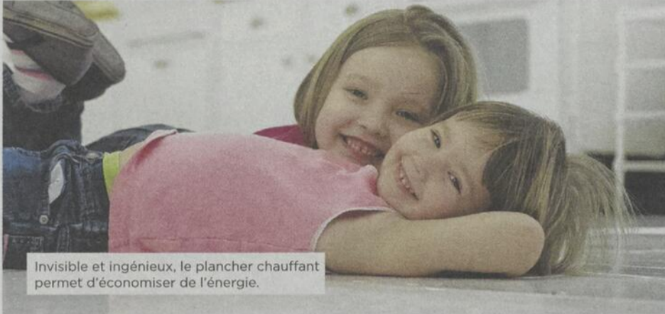
Invisible et ingénieux, le plancher chauffant permet d'économiser de l'énergie.

Qu'il est désagréable de marcher pieds nus sur un plancher glacial lors d'une visite nocturne au petit coin! Si vous rêvez de vous déplacer chez vous sans devoir enfiler de grosses pantoufles encombrantes, installez un plancher chauffant!