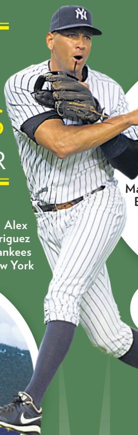
Alex Rodriguez des Yankees de New York

AVEC 65 MILLIARDS BILL GATES POURRAIT ACHETER