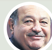
GRAPHISME JACQUES-OLIVIER BRAS, LA PRESSE

... le plus riche du monde, Carlos Slim 68 milliards