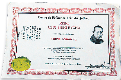
LE DIPLÔME OBTENU EN UNE DEMI-JOURNÉE PAR LA PRESSE