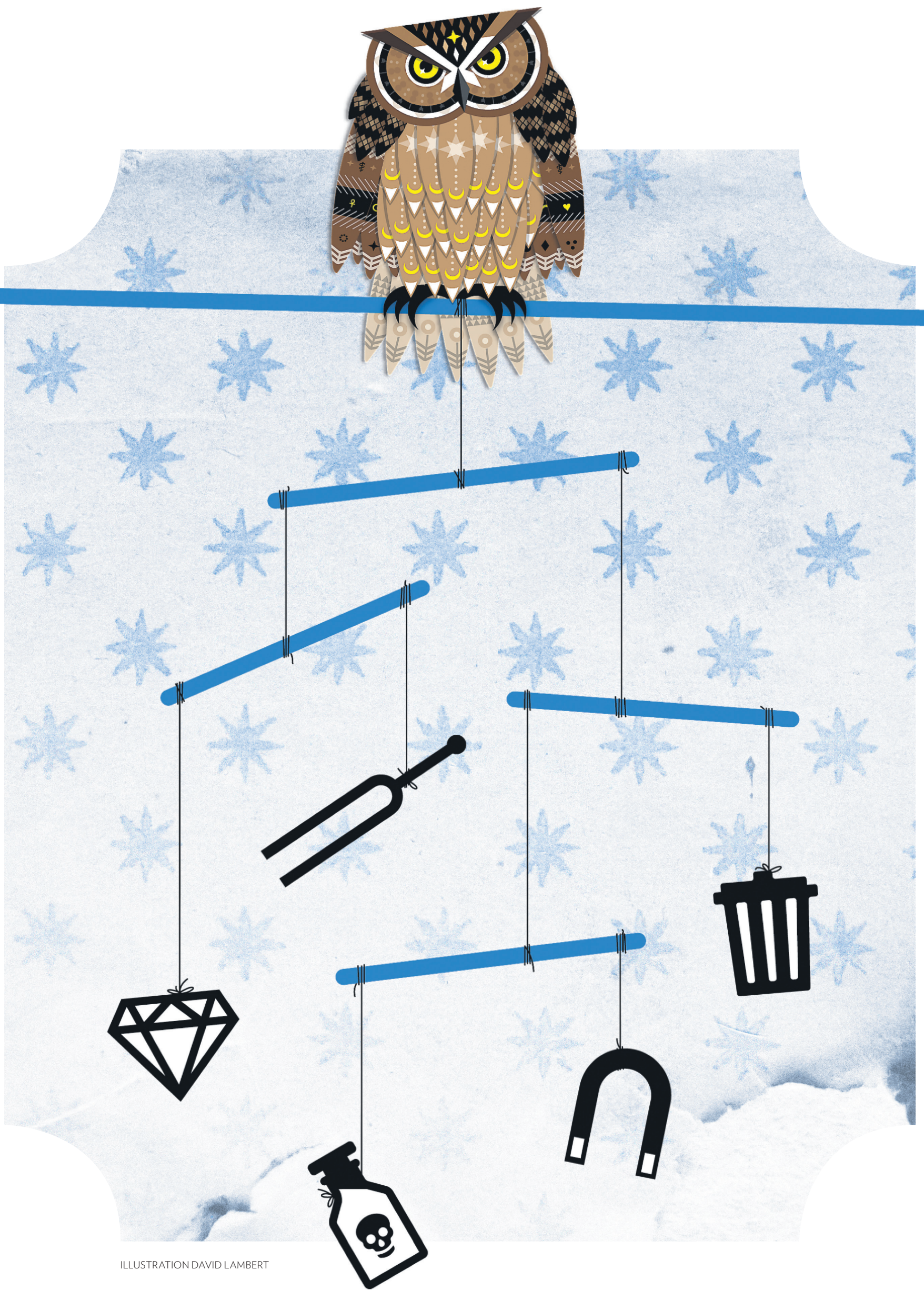
ILLUSTRATION DAVID LAMBERT