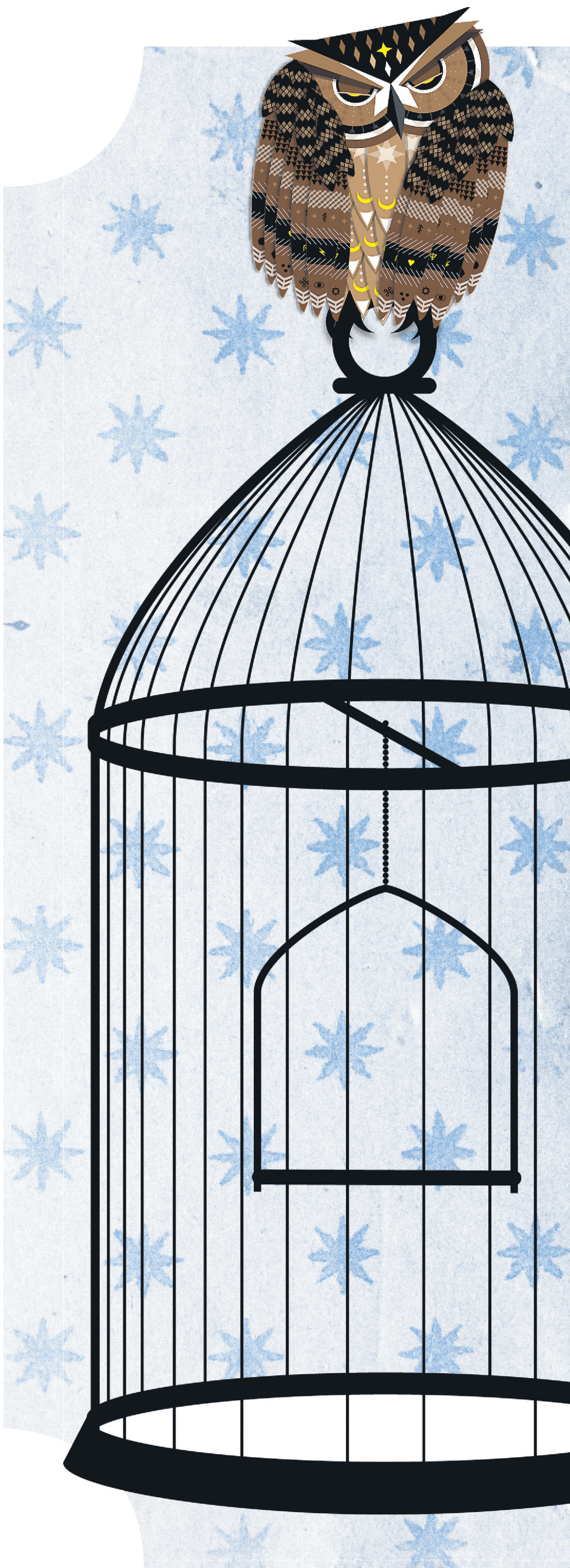
ILLUSTRATION DAVID LAMBERT