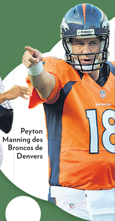
Peyton Manning des Broncos de Denver

› TOUS LES CLUBS de baseball majeur ( 15,4 milliards ).