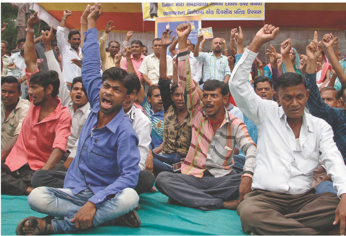
Des membres de la caste des dalits se sont rassemblés en guise de soutien aux quatre dalits agressés.

Depuis l'arrivée au pouvoir, en 2014, du Bharatiya Janata Party (BJP) le parti du premier ministre indien, Narendra Modi, lui-même originaire du Gujarat, ces escadrons de nationalistes hindous ont gagné en visibilité. Dans les États qui ont interdit l'abattage et la consommation de bœuf, ils agissent souvent de concert