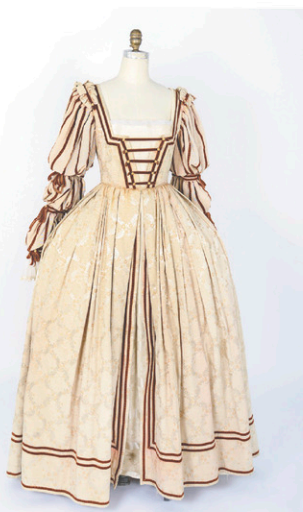
LE GRAND COSTUMIER

«Nous devons poser de la pellicule antibuée dans la centaine de fenêtres de nos lo-