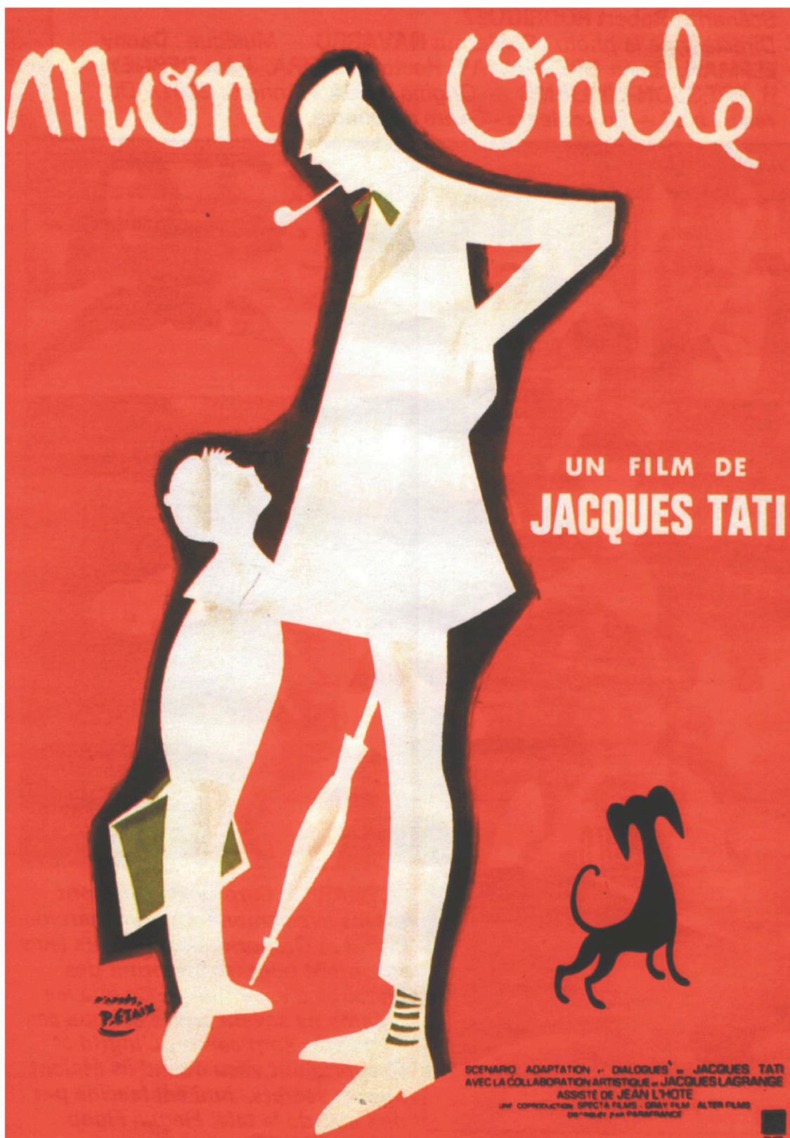
L'affiche originale du film par Pierre Etaix

«Enfin, [la couleur] lui donne aussi l'occasion d'estomper cette opposition, en décrivant des espaces entre deux zones (des bouts de mur qui tombent, des grillages déchirés),