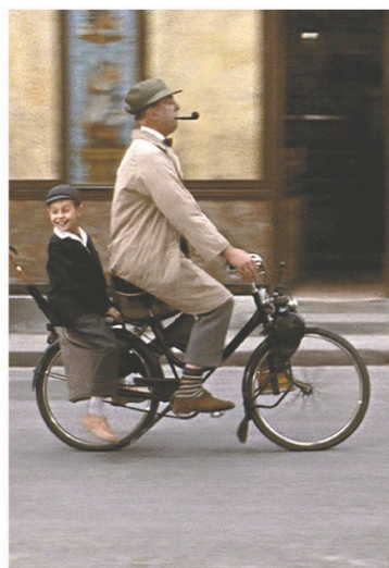
Le petit Gérard et son oncle, monsieur Hulot

Quel est votre film coup de cœur? Dans quel contexte l'avez-vous vu? Pourquoi vous a-t-il plu à ce point? La série durera tant qu'il y aura des films. En 250 mots environ, la parole est à vous à l'adresse cesfilms@ledevoir.com