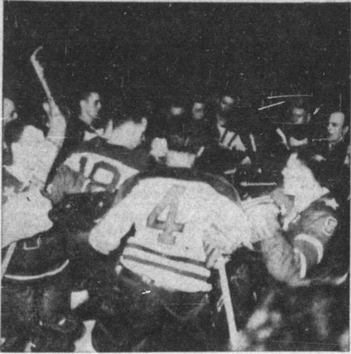
Il y eut beaucoup d'action dans la partie d'hier entre Shawinigan et Edmonton. On en voit ici une démonstration alors qu'une bagarre générale a éclaté. Les deux clubs ont actuellement gagné chacun une partie.