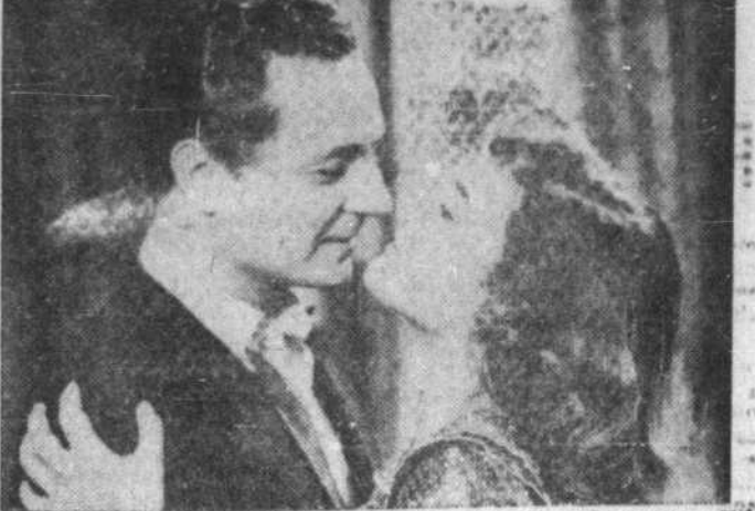
AU SAINT-DENIS: Une scène du film "La Cage aux Filles", mettant en vedette Danièle Delorme, qui prend aujourd'hui l'affiche au Saint-Denis. Au même programme: "Le Voile Bleu", avec Gaby Morlay.