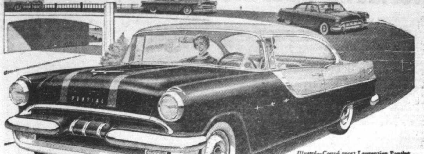
Illustré—Coupe sport Laurentien Pontiac UNE VALEUR GENERAL MOTORS