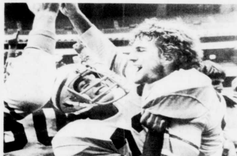
Les Géants de St-Jean célèbrent leur victoire de 35-0 remportée sur les Vulkins de Victoriaville pour mériter leur premier Bol d'Or dans la division AA.