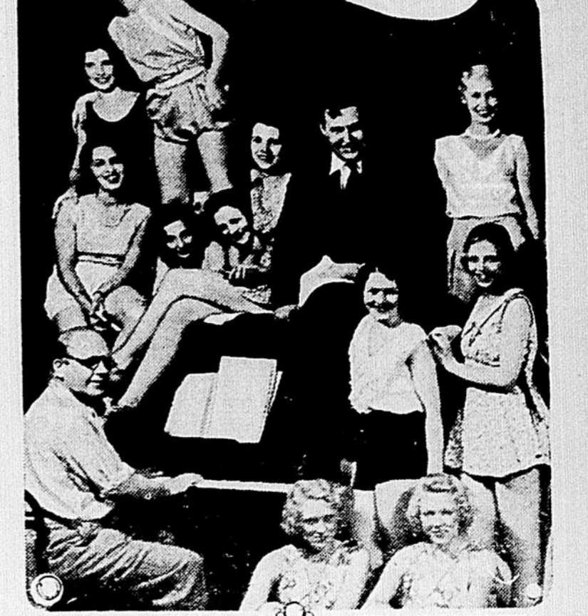
Les acteurs de la revue "A bas le travail!" dirigés par le chroniqueur Heywood Brown. On le voit, entouré des danseuses et des choristes de la revue qu'il a improvisée pour donner de l'emploi aux chômeurs de la scène sur le Broadway.