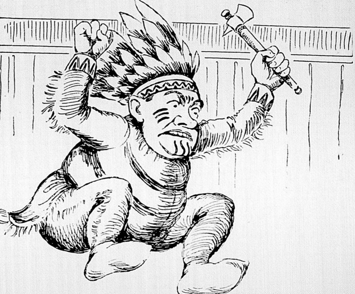
CAMILLIEN. — Hein! ce que j'en ai envoyé revolter, des cervelles, tout le long de la rue Saint-Jacques! Maintenant, il n'y a plus qu'un cerveau à l'hôtel de ville, le mien, pour vous servir messieurs et dames...