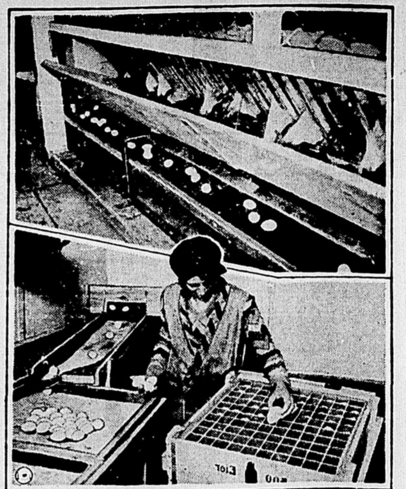
C'est vraiment une usine que ce poulailler géant, où des milliers de poules sont gardées. Tout est organisé de manière qu'un œuf, à peine pondu, tombe sur une courroie en mouvement et est immédiatement transporté à une salle où il est mis en caisse. De cette manière, on est assuré que les œufs sont strictement frais puisqu'ils sont offerts aux consommateurs quelques heures après avoir été pondus.

qui s'opère généralement à Paris autour des lieux de plaisir: cafés, restaurants de nuit, dancings, etc., c'est une lutte intéressante entre les marchands de coco et les policiers. Songez que la coco, qui coûtait de 1 fr. à 2 fr. le gramme, il y a une douzaine d'années, vaut aujourd'hui de 5 à 6 francs, mais qu'elle rapporte cent fois, mille fois plus, davantage peut-être encore, aux détaillants. Car les cocaïnomanes en sont tellement avides, qu'ils ne regardent guère au prix. Entre eux et les vendeurs, se sont établies peu à peu des relations occultes, dont la justice n'arrive que très difficilement à démêler les fils.