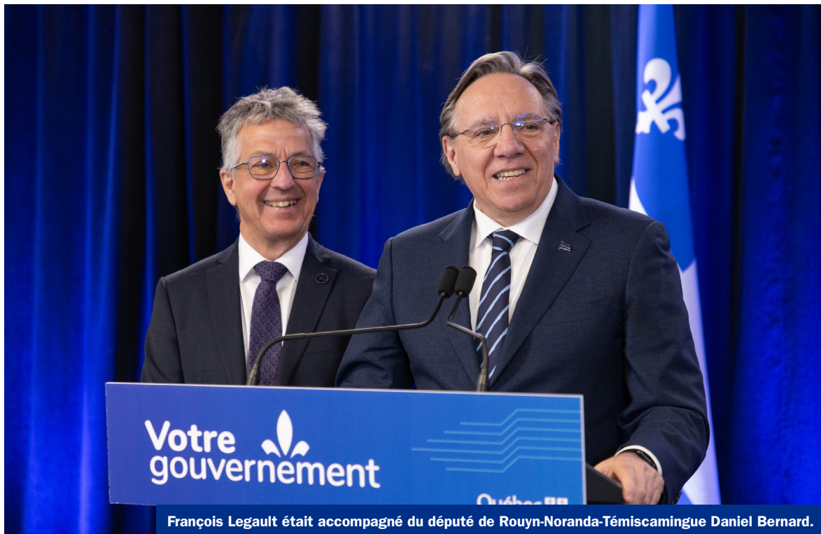
François Legault était accompagné du député de Rouyn-Noranda-Témiscamingue Daniel Bernard.

Du côté de Glencore, M. Legault se montre ouvert à la proposition de la compagnie, qui souhaite obtenir dix-huit mois supplémentaires pour compléter l'investissement de 300 M$ visant à réduire les émissions. « Si le conseil municipal de Rouyn-Noranda accepte, le gouvernement va accepter aussi. »