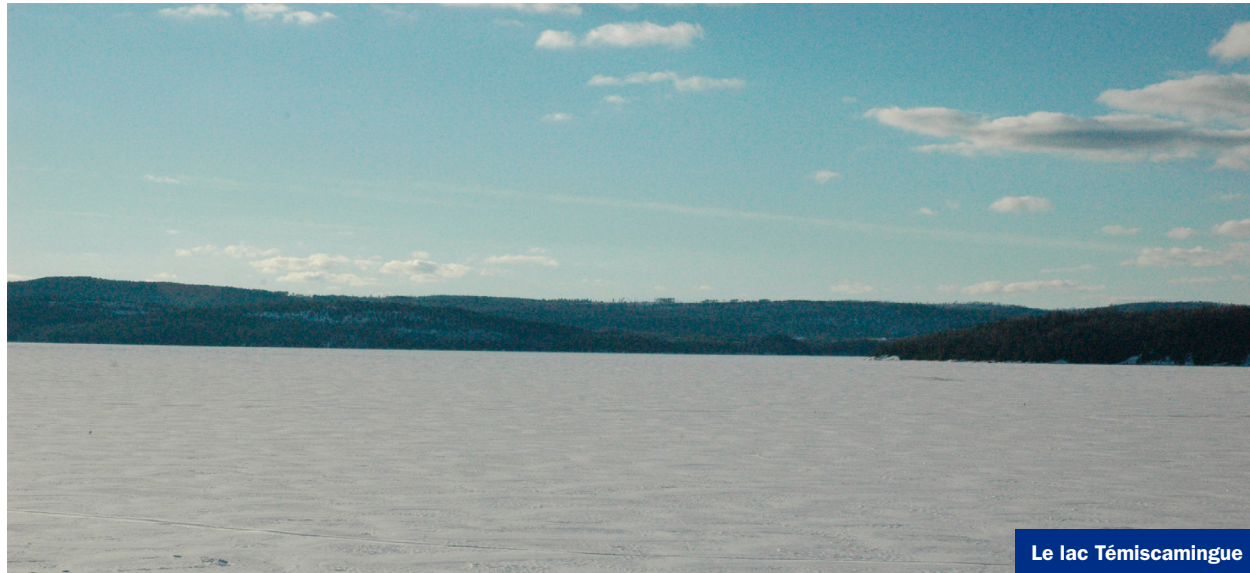
Le lac Témiscamingue

La Société de sauvetage rappelle plusieurs réflexes essentiels selon les activités. En pêche sur glace, il est