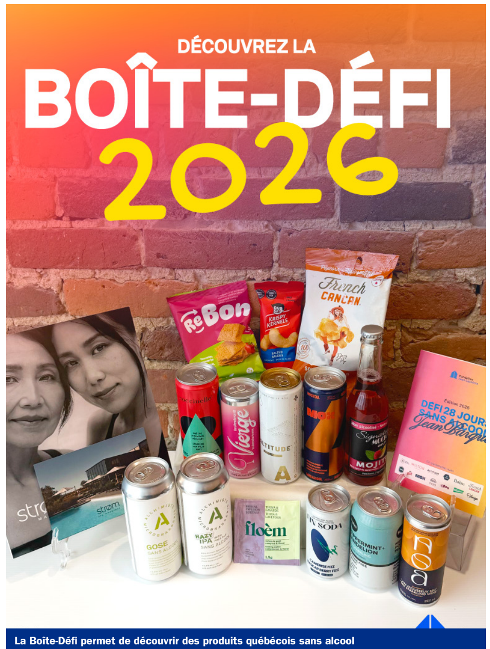
La Boîte-Défi permet de découvrir des produits québécois sans alcool

En s'inscrivant au Défi 28 jours sans alcool, « on contribue à ce bel organisme [qu'est la Fondation Jean Lapointe]. Ils aident les gens qui ont des problèmes de dépendance, mais ils font aussi de l'éducation auprès des jeunes. [...] C'est quand on est jeunes qu'on se fait influencer le plus par les chums pour boire et sortir. Le discours est le même chez les jeunes : avoir une autre voix qui vient dire que peut-être que vous êtes rendus à un niveau un peu trop élevé [de consommation]. »