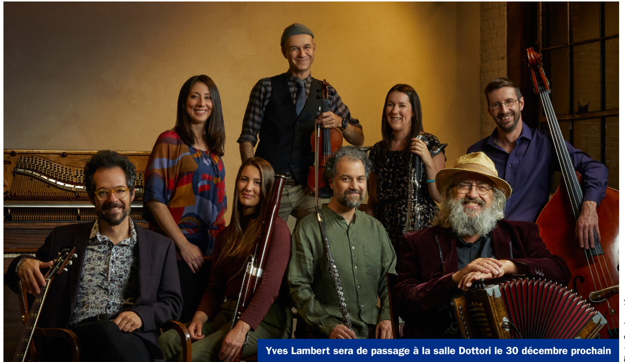
Yves Lambert sera de passage à la salle Dottori le 30 décembre prochain

Cette année, Yves Lambert célèbre ses 50 ans de carrière. Le 30 décembre prochain, à la salle Dottori, il présentera un spectacle spécialement conçu pour l'occasion, retraçant les moments phares de son parcours, de ses débuts avec La Bottine Souriante jusqu'à aujourd'hui. Porté par des orchestrations explorant de nouvelles avenues harmoniques et rythmiques, il interprétera ses titres les plus connus, La poule à Colin , La Ziguezon , La Cuisinière , Dans nos vieilles maisons , ainsi que plusieurs chansons qui ont façonné son univers musical.