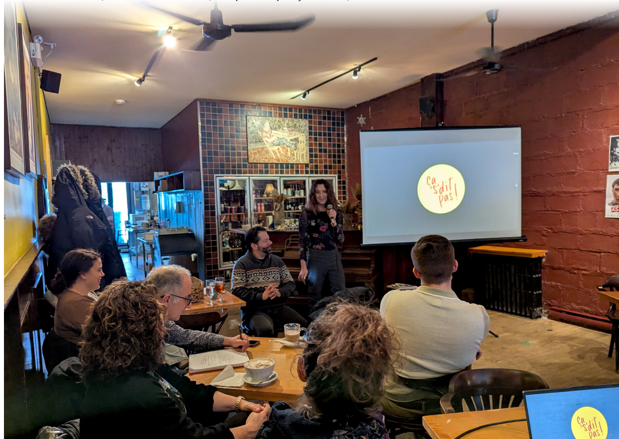
La campagne vise une sensibilisation et une compréhension de ce qui peut ou non blesser l'autre avec les mots.

« Si des gens sont victimes de propos qu'ils trouvent discriminatoires et qui n'ont pas été couverts par la campagne, s'ils veulent entrer en contact avec nous [le RÉPAT] pour réfléchir à des actions concernant ces enjeux-là et ces discriminations dont ils sont victimes, ça nous ferait plaisir de prendre le vécu des personnes pour réfléchir à une prochaine campagne. [...] On essaie de ratisser large et de toucher à tous les types de discrimination, mais plus il y a de cerveaux qui participent à ça, plus on peut aller loin », conclut la coordonnatrice du RÉPAT.