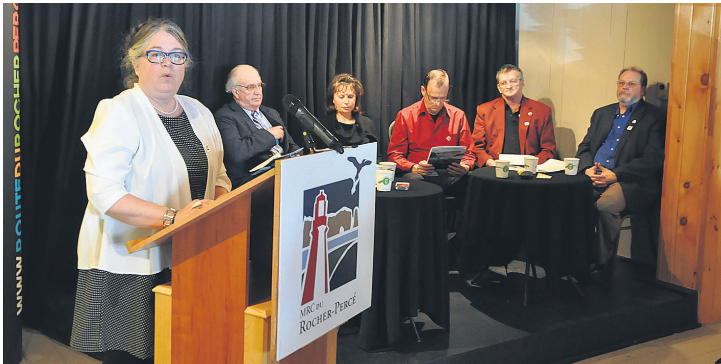
Les principaux acteurs de ce nouveau plan de développement stratégique dans la MRC du Rocher-Percé

La préfète et les maires ont souligné le travail que toute la communauté a mis afin d'arriver à ce plan, qui s'étendra jusqu'en 2019. Les organismes communautaires comme les entreprises privées, en plus des différents paliers de gouvernements, ont tous mis la main à la pâte afin d'arriver à un plan derrière lequel tous peuvent se rallier. « Il faut arrêter de saupoudrer un peu partout, c'est pour ça qu'on s'est dotés d'un plan qui va mener nos projets à leur aboutissement », a conclu la préfète.