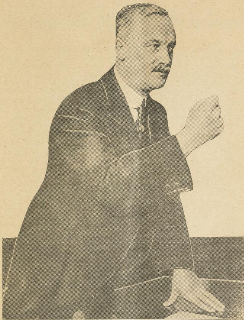
L'Honorable E.-L. Patenaude