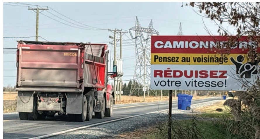
Des citoyens du chemin de la Butte-aux-Renards ont enregistré près de 20 000 passages de camions en septembre, dont 8 000 pour la construction de Northvolt.