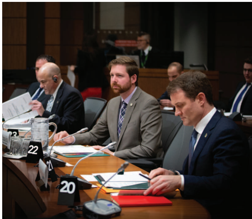
Le député Xavier Barsalou-Duval.

« Au Québec, si on circule sur une route, c'est automatique, il y a toujours des règles. Il y a des limites de vitesse, des zones scolaires comme des endroits où les camions lourds sont autorisés ou non. Sur les cours d'eau du fédéral, c'est le vide sidéral. À défaut d'une démarche pénible et fastidieuse initiée par le milieu et dans laquelle tout le fardeau de la preuve repose sur les demandeurs, c'est le Far West », déplore Xavier Barsalou-Duval, dans un communiqué de presse.