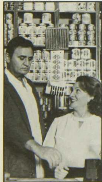
«Le Coup de sirocco»

La critique a dit que ce film doux-amer aborde le problème de la réintégration des colons algériens avec une certaine bonne humeur. Le tout donne un récit pittoresque et sympathique qui s'attache aux détails humains familiers.