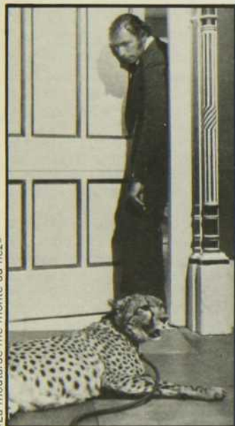
«La moutarde me monte au nez»