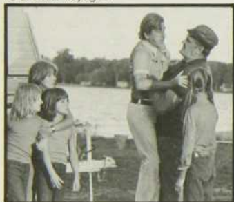
«J'ai mon voyage»