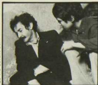
«La Vie devant soi»