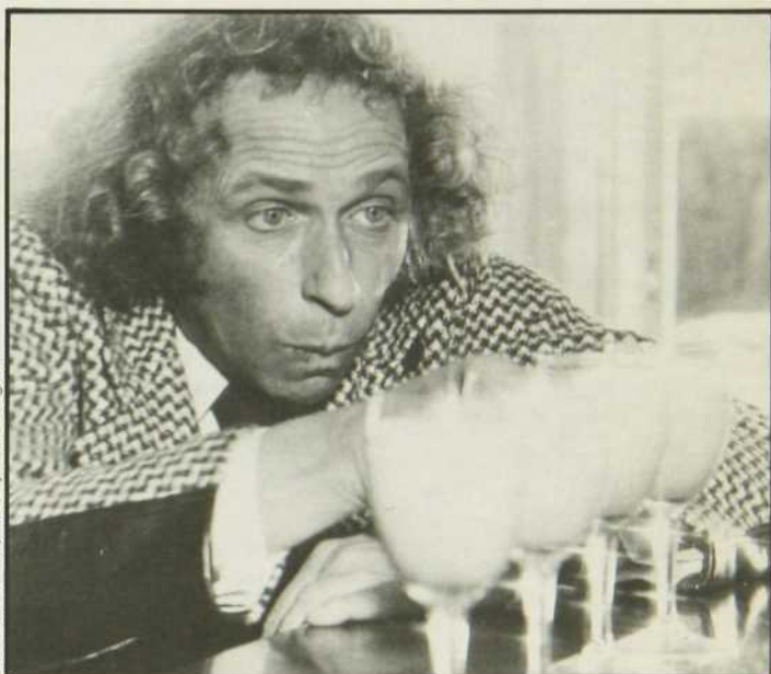
«Je suis timide, mais je me soigne»

Et pour terminer la semaine, de grands films comme Police Python , avec Yves Montand et Simone Signoret, nous seront proposés. Nous verrons également Jamais je ne t'ai promis un jardin de roses , qui illustre l'expérience d'une jeune femme en milieu psychiatrique, et le bien connu Butch Cassidy et le Kid , avec Paul Newman et Robert Redford; Peur sur la ville , avec Jean-Paul Belmondo, et Providence , avec Dick Bogarde et Bernard Blier.