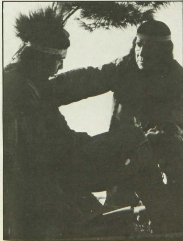
«Le Chemin des esprits»

Richard Garneau est le narrateur de la série Exploration, sports et loisirs , une réalisation de Robert Séguin. Production: Télé-Montage Inc.