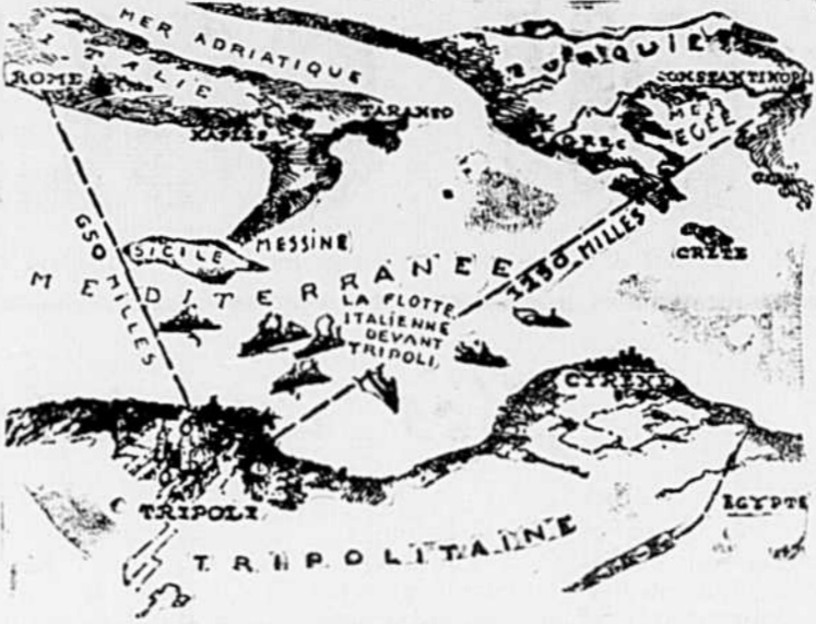
Cette carte indique la position de Tripoli par rapport à l'Italie et Constantinople. C'est que les Italiens ont enlevé la ville aux Turcs le 5 octobre 1911. On voit aussi la petite île de Crète qui sert actuellement aux Anglais de base navale et aérienne. C'est de là que sont venus les navires et les avions britanniques qui, en 1941, ont attaqué simultanément la ville, le port et les environs.