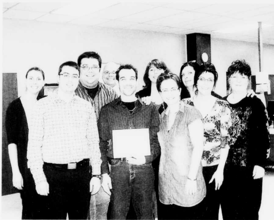
L'équipe d'Odysée Québec-Monde et quelques-uns de ses participants.