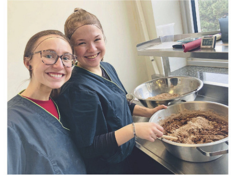
Au total, 200 personnes fréquentant l'organisme recevront un emballage de cinq desserts variés avec leur panier de nourriture.

Point de Rue entend distribuer ses paniers le 22 décembre prochain.