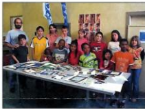
Accueil, accueil, accueil. The team