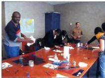
Artimage cultural project. Partners at work