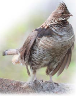
Gélinothe huppée