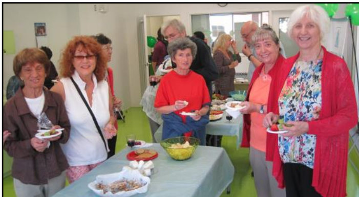
Vin et fromage des Portes Ouvertes