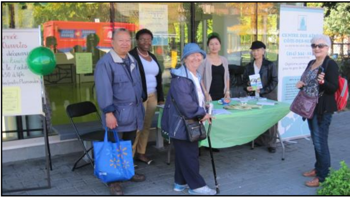
Visite des aînés au kiosque