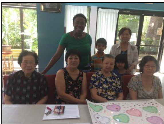
Activité JMC: Vie et ressources de mon quartier

L'Atelier de dessin à Isabella fut, quant à lui, un vrai coup de cœur ! On a pu le constater non seulement par sa popularité, mais aussi par l'initiative que le groupe a prise de souligner l'anniversaire de chaque personne participante.