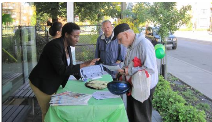
Visite des aînés au kiosque