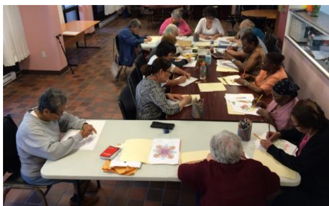
Atelier de dessin à l'HLM Isabella

Le 19 juillet 2016, l'activité JMC (Je m'engage dans ma communauté) de Projet Changement intitulée "La vie et les ressources de mon quartier", a été réalisée à Goyer. Cette activité favorise l'inclusion et le sentiment d'appartenance des participant(e)s à leur communauté et ainsi que leur connaissance des lieux et des ressources significatives du quartier.