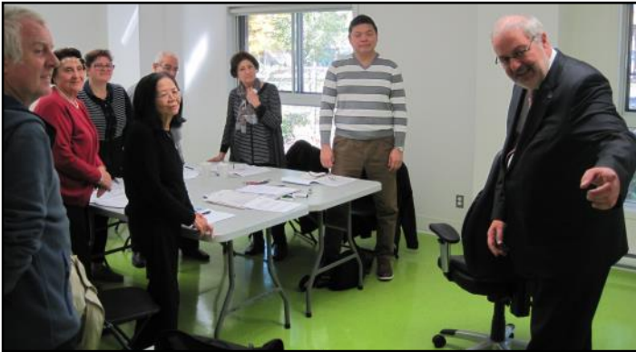
M. Pierre Arcand, Ministre et député du Mont-Royal