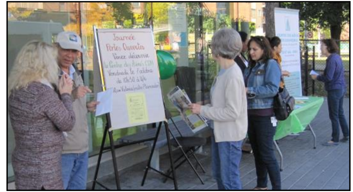
Visite des aînés au kiosque