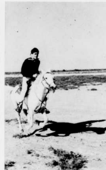
« bob morane »