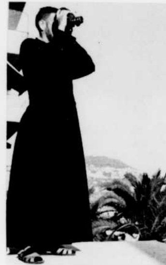
« nos frères, les hommes »

Le réseau français de Radio-Canada a inscrit à l'horaire, cette année, une nouvelle série d'aventures avec nul autre que Rocambole. Le jeudi 9 septembre à 8 h. 30, Rocambole fera ses débuts au réseau français de Radio-Canada. Aventurier du bien, Rocambole affrontera tous les dangers pour le triomphe de la vérité et de la justice.