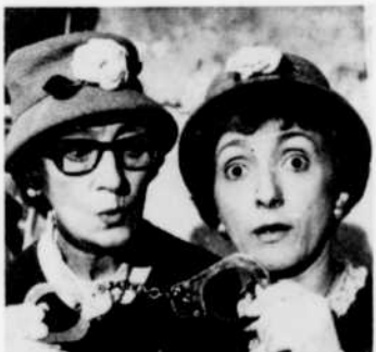
"Signé Berthe et Blanche", le mercredi soir à 10 heures.

"Les Poupées d'amour", drame de Rudolf Jugert, avec Joachim Fuschberger et Christine Gorner. A Amsterdam, de jeunes filles sont engagées comme danseuses dans un cabaret, puis envoyées à La Havane pour être livrées à la prostitution. Une jeune journaliste se présente comme danseuse afin d'étudier le milieu.