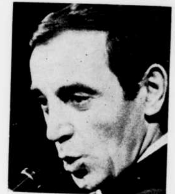
"Ils parlent et chantent" nous présente Charles Aznavour, samedi soir à 7 h. 30.